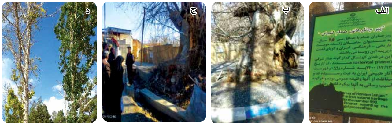
شکل ۳- مشکلات درختان کهن‌سال: الف) مخدوش بودن تابلوی ثبت ملی درخت چنار روستای همام؛ ب و ج) محصورشدن درختان کهن‌سال چنار با رفوژهای سیمانی، به‌ترتیب در روستاهای خشوئییه و همام؛ د) علائم عارضه کلروز و سرخشکیدگی درختان چنار کهن‌سال روستای همام