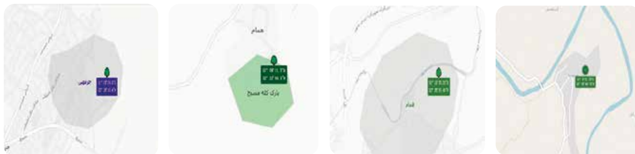
شکل ۲- موقعیت درختان کهن‌سال مورد بررسی در شهرستان لنجان همراه با مختصات جغرافیایی آن‌ها چرمهین

ج) فشرده‌گی و تهویه نامناسب خاک: ریشه‌های گیاهان در شرایط تهویه ناکافی، دچار اختلال در تنفس می‌شوند، این مورد یک سری