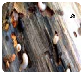
شکل ۵- حشرات آفت و خسارت آن‌ها: الف و ب) علائم خسارت آفت چوب‌خوار روی درختان چنار به ترتیب در روستاهای خشوئیه و همام، ج) علائم خسارت آفات پوست‌خوار روی درخت چنار روستای همام، د) لارو سوسک‌های چوب‌خوار، ه) لارو سوسک‌های پوست‌خوار