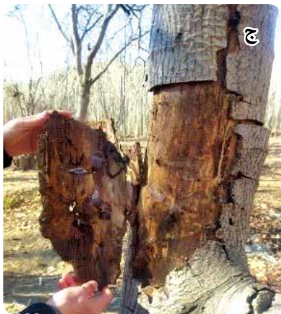
شکل ۴- جنگل‌های صنوبر دست‌کاشت در جوار درختان کهن‌سال در روستای خشوئیه: الف) نمایی از جنگل صنوبر، ب) کنده‌های باقی‌مانده درختان، ج) علائم خسارت آفات چوب‌خوار و پوست‌خوار