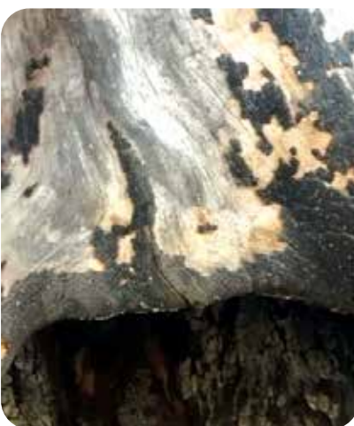
شکل ۷- خسارت ناشی از آتش‌سوزی و ترمیم غلط حفره داخل تنه درخت چنار در روستای خشوئیه