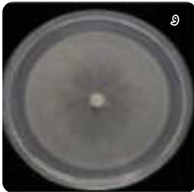
شکل ۶- بیماری‌گرهای گیاهی و خسارت آن‌ها: الف و ب) علائم پوسیدگی طوقه و ریشه درخت چنار روستای کلمه‌مسیح و درگیری شدید یکی از تنه‌های اصلی آن درخت، ج) علائم پوسیدگی طوقه و ریشه درخت توت شهر جرمین، د) علائم بیماری شانکر سیتوسیرایی روی درخت چنار محله کلمه‌مسیح ه) رشد قارچ فایتوفترا روی محیط کشت، و) اسپور قارچ در مقیاس 20 μm