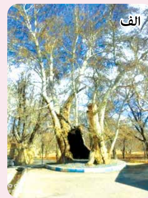
شکل ۱- درختان کهن‌سال مورد بررسی: الف) درخت چنار روستای همام، ب) درخت چنار روستای خوشئویه، ج) درخت چنار محله کله‌مسیح، د) درخت توت شهر چرمهین