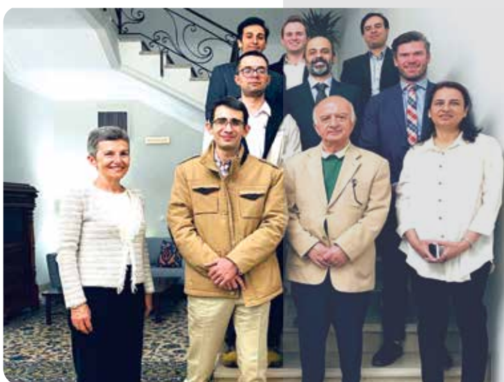
رزیدنت سفیر سابق استرالیا- دانش آموختگان استرالیا به همراه ایشان