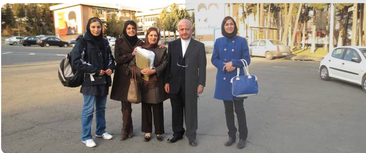
آقای دکتر مخدوم به همراه دانشجویان شان