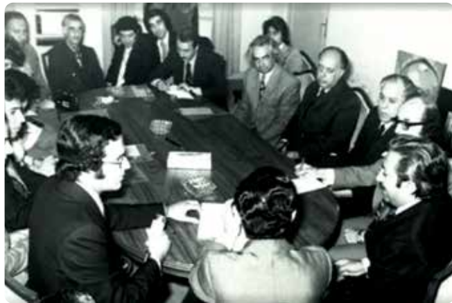
جلسه گازسوز کردن اتوبوس‌ها و تاکسی‌های شهر شیراز

حقوقی دارد. اسکندر فیروز در تیر ۱۳۵۶ (ش)، علاوه بر آنکه از ریاست سازمان حفاظت محیط‌زیست استعفا کرد، ریاست اتحادیه جهانی حفاظت را نیز نپذیرفت. او همچنین از سال ۱۳۵۰ (ش) تا ۱۳۵۷ (ش) دبیرکل هیات امنای باغ گیاه‌شناسی ملی ایران بود، همچنین طرح زیست‌محیطی پارک جنگلی پردیسان را در کارنامه خود دارد. نمونه ایده‌ای که ایشان برای پارک پردیسان داشتند، در زمان خود در دنیا وجود نداشت، که متأسفانه اجرایی نشد. ایشان طرحی برای پارک پردیسان ترسیم و تنظیم نموده بودند که تمام زیستگاه‌های ایران به همراه حیات وحش آنها را در مقیاسی کوچک‌تر پیاده نمایند، به طوری که بتوان در یک گشت در پردیسان، زیستگاه‌های ایران را مشاهده کرد، به عبارتی ایرانی کوچک در پردیسان. با کوشش او، مناطق چهارگانه تحت حفاظت ایران با نام‌های پارک ملی، اثر طبیعی ملی، پناهگاه حیات وحش و منطقه حفاظت‌شده تعیین شدند. در یکی از مراسم‌هایی که هر ساله به مناسبت گرامیداشت روز تصویب کنوانسیون حفاظت از تالاب‌های مهم بین‌المللی و زیستگاه پرندگان آبی برگزار می‌شد، دبیرخانه این کنوانسیون از اسکندر فیروز به‌عنوان پدر تالاب‌ها یاد کرد، چرا که تلاش‌های او سبب شد که نام تالاب جایگزین مرداب شود. او