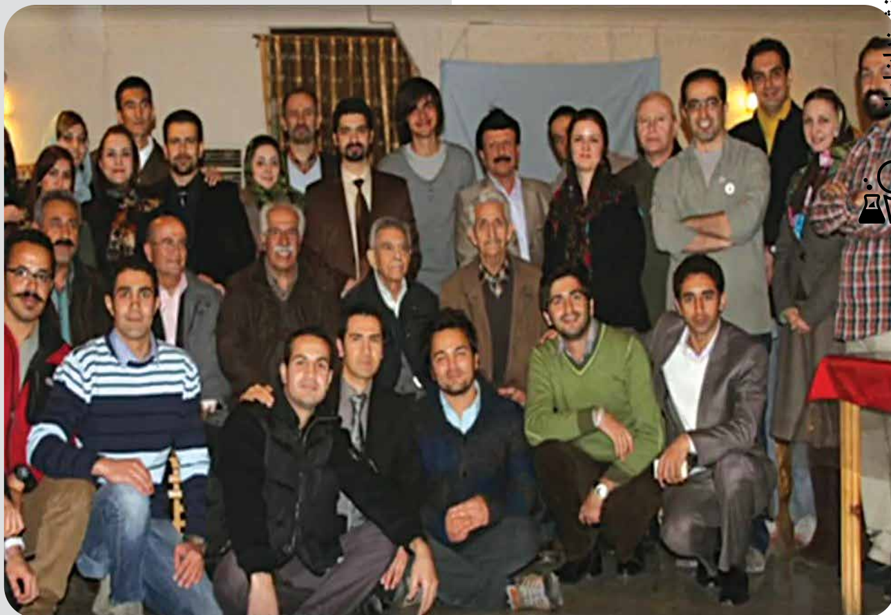
اسکندر فیروز در جمع فعالان محیط‌زیست

در آمریکا درگذشت و چه جالب که عروج او مصادف با آغاز هفته منابع طبیعی در ایران است. ایران هرگز او را فراموش نخواهد کرد. تمام عمر را صرف دیار و یار می‌کرد، سحر را تا به شب، شب تا سحر هم کار می‌کرد، از او ایران همانند گلستان گشته بود و تلاش و همتش از حد گذشت، اینار می‌کرد همه اهل جهان سودای ایرانشان به سر بود چه نیک و با شکوه آن را سکندروار می‌کرد