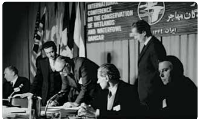
انعقاد اولین کنوانسیون حفاظت از تالابها و زیستگاه پرندگان آبی