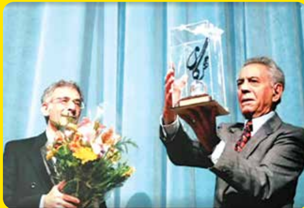
دریافت جایزه مهرگان ۱۳۸۰ (ش)

در سال ۱۳۵۰ (ش)، اسکندر فیروز، رئیس اجلاس سازمان ملل متحد برای آماده‌سازی کنوانسیون‌های مربوط به کنفرانس جهانی استکهلم شد. در سال ۱۳۵۱ (ش)، هنگامی که نخستین کنفرانس جهانی محیط‌زیست در استکهلم برگزار شد، او نایب‌رئیس این نشست بود. بین سال‌های ۱۳۵۲ (ش) تا ۱۳۵۴ (ش)، به عضویت هیئت‌مدیره اتحادیه جهانی حفاظت محیط‌زیست در آمد و از سال ۱۳۵۴ (ش) تا ۱۳۵۶ (ش) نایب‌رئیس این اتحادیه و عضو هیئت‌مدیره صندوق جهانی طبیعت شد. در سال ۱۳۵۳ (ش)، یکی از مهم‌ترین قوانین زیست‌محیطی ایران با عنوان قانون حفاظت و بهسازی محیط‌زیست را تصویب کرد که در ایران اعتبار