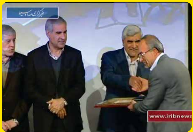
اخذ جایزه از وزیر محترم فرهنگ و آموزش عالی - سال ۱۳۹۵ (ش)