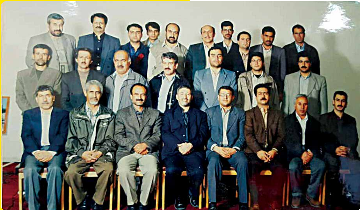
تیم مطالعاتی شناسایی کانون های بحرانی فرسایش بادی - سال ۱۳۸۰ (ش) - یزد

ارشد و دکتری تدریس می‌کنند. همچنین، ایشان تاکنون استاد راهنما و استاد مشاور بیش از ۱۲۰ پایان‌نامه کارشناسی ارشد و رساله دکتری بوده‌اند.