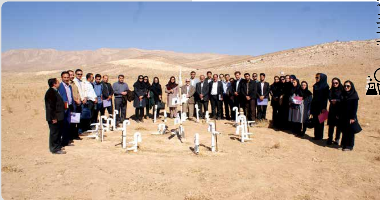
راه‌اندازی ایستگاه سنجش فرسایش بادی در سایت باجگاه دانشگاه شیراز-۱۳۹۵(ش)

اولویت تعیین، پیگیری و رصد نمود. این در حالی است که به نظر می‌رسد، امروزه راهبرد اصلی منابع طبیعی در کشور برعکس شده و بیشتر به سمت بهره‌برداری - احیاء و در نهایت حفاظت سمت و سو یافته است و این مهم می‌تواند برای آینده منابع طبیعی ایران بسیار خطرناک باشد». ایشان ضمن پاسداشت خدمات پیشکسوتان حفظ منابع طبیعی و مهار بیابان‌زایی کشور که در عرصه‌های مختلف کشور انصافاً زحمت می‌کشند، معتقد است این افراد باید فضای کار را برای نسل کنونی فراهم کنند. وی به این نکته مهم اشاره می‌کند که شرایط جدید برای بیابانی شدن بسیار حساس‌تر و شکننده‌تر از گذشته است. بنابراین، باید با نگاهی هوشمندانه‌تر نتایج اقدامات گذشته را ارزیابی نمود و بهترین راهبردها را برای ایرانی آباد و پایدار تدوین و انتخاب کرد.