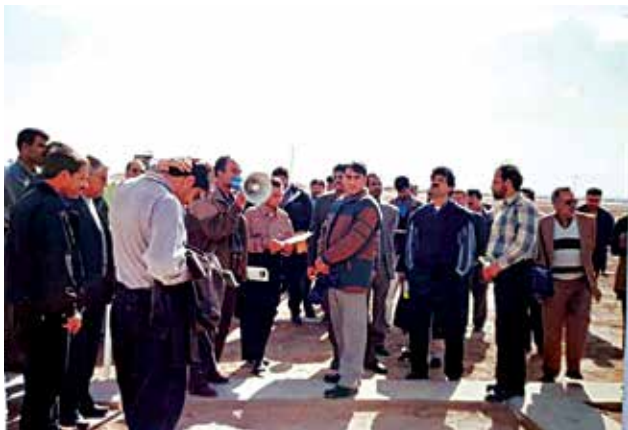
آموزش کارشناسان بخش اجرا - سال ۱۳۸۰ (ش)، شهرستان نائین

از نظر دکتر اختصاصی «علم منابع طبیعی، علمی کاملاً تجربی و مهارتی است و این تجربیات است که تبدیل به علم می‌شود، یا باید بشود. اما متأسفانه بیشتر کارشناسان این بخش پس از سال‌ها کسب تجربه، بدون اینکه تجارب آنها ذخیره، یا مکتوب شود و به آیندگان، یا نسل جدید منتقل شود، بازنشسته می‌شوند. به همین دلیل بسیاری از پروژه‌ها در بخش منابع طبیعی با ریسک زیاد یا شکست همراه