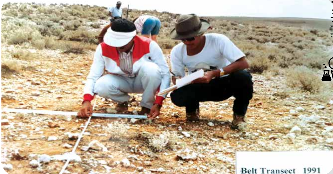
Belt Transect 1991