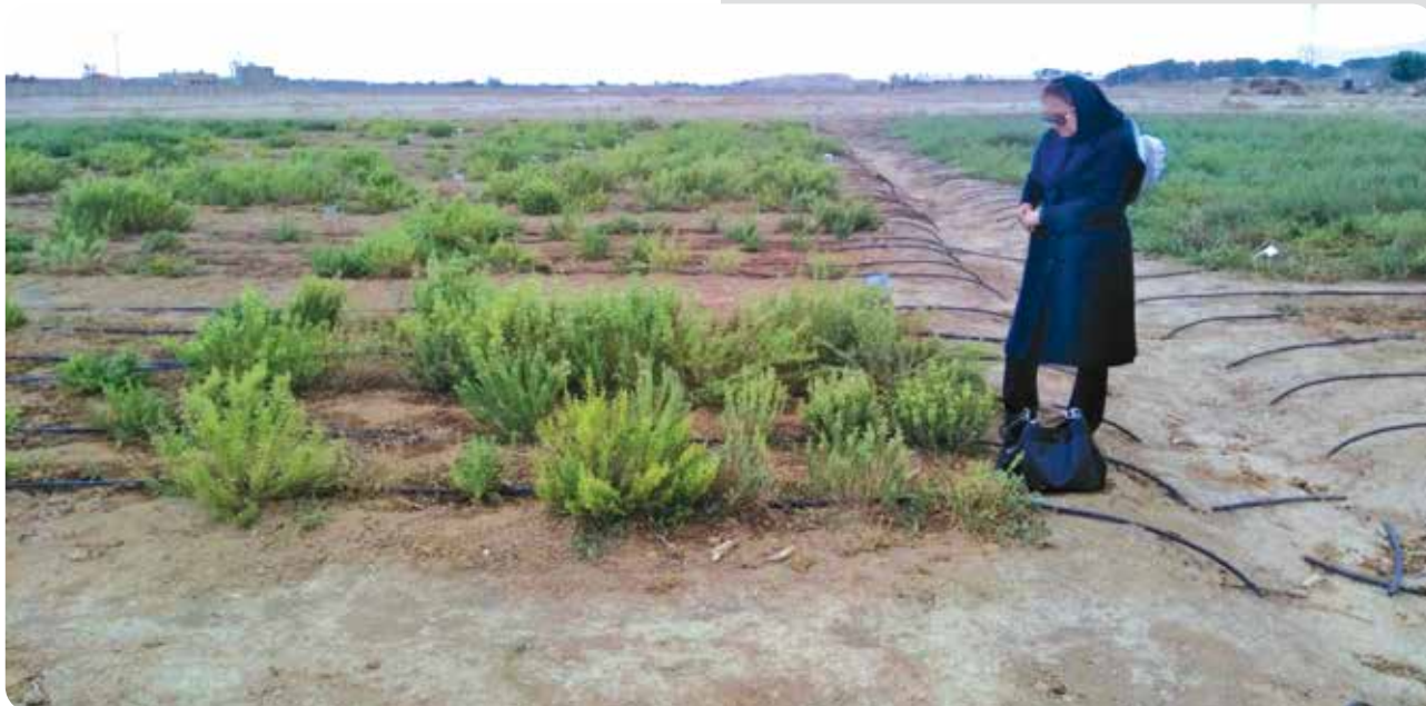
بازدید از ایستگاه تحقیقاتی، ارزشیابی طرح‌های پژوهشی استان اصفهان، ایستگاه تحقیقاتی شهید فزوه، مهر ۱۳۹۷ (ش)

- عضو گروه ارزشیابی طرح‌های پژوهشی ستاد مؤسسه - عضو کمیته تهیه ششمین گزارش ملی تنوع زیستی کشور - عضو کمیته تهیه آیین‌نامه اجرایی شرایط دسترسی و نحوه بهره‌برداری ژنتیکی موضوع ماده (۶) قانون حفاظت و بهره‌برداری از منابع ژنتیکی کشور