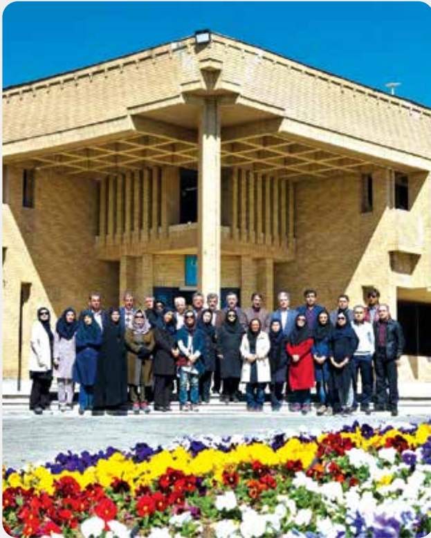
همکاران بخش تحقیقات گیاهشناسی و گروه تحقیقات باغ گیاهشناسی ملی ایران، سال ۱۳۹۵ (ش)

و تکمیل رویشگاهها و کلکسیونهای باغ گیاهشناسی و پرورش و آموزش کارشناسان و محققان علاقه‌مند و متخصص بوده است. جدیدت، دقت، تمرکز، نکته‌سنجی، سخت‌کوشی و مطالعه مستمر از ایشان شخصیت یگانه‌ای ساخته است که در همه حیطه‌های فعالیتشان طی دوران کاری خود آثار ماندگاری برجای گذاشته‌اند تا جایی که گفتن و نوشتن از تاریخچه باغ گیاهشناسی ملی ایران و مؤسسه تحقیقات جنگلها و مراتع کشور بدون ذکر فعالیت‌های ایشان میسر نیست.