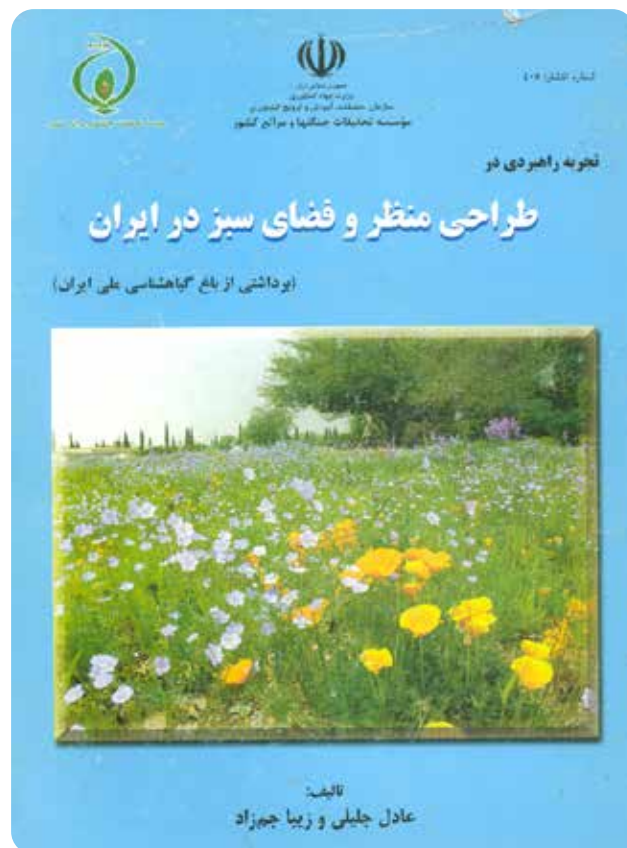
دو کتاب طراحی منظر و کتاب قرمز گیاهان ایران، تألیف دکتر زیبا جمزاد