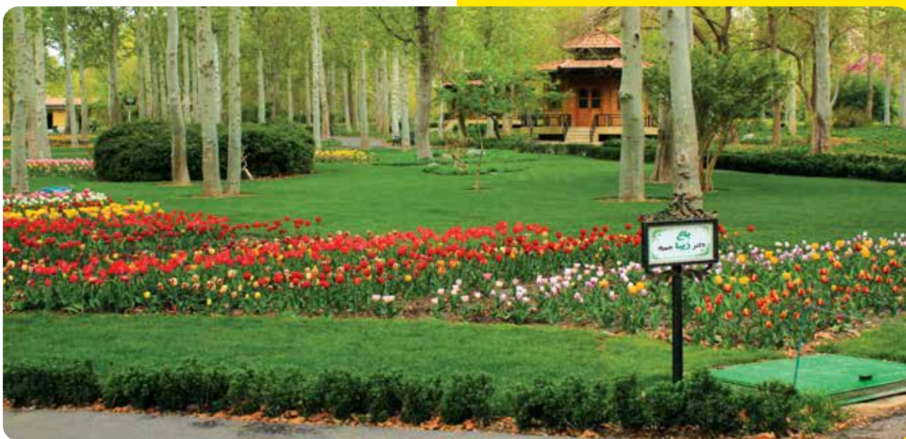
باغ دکتر زیبا جم‌زاد در باغ گیاه‌شناسی ملی ایران