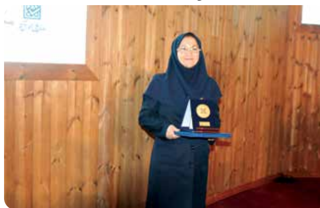
مراسم برگزیدگان نخستین جایزه زنان در علم، کتابخانه ملی جمهوری اسلامی، مرداد ۱۳۹۶