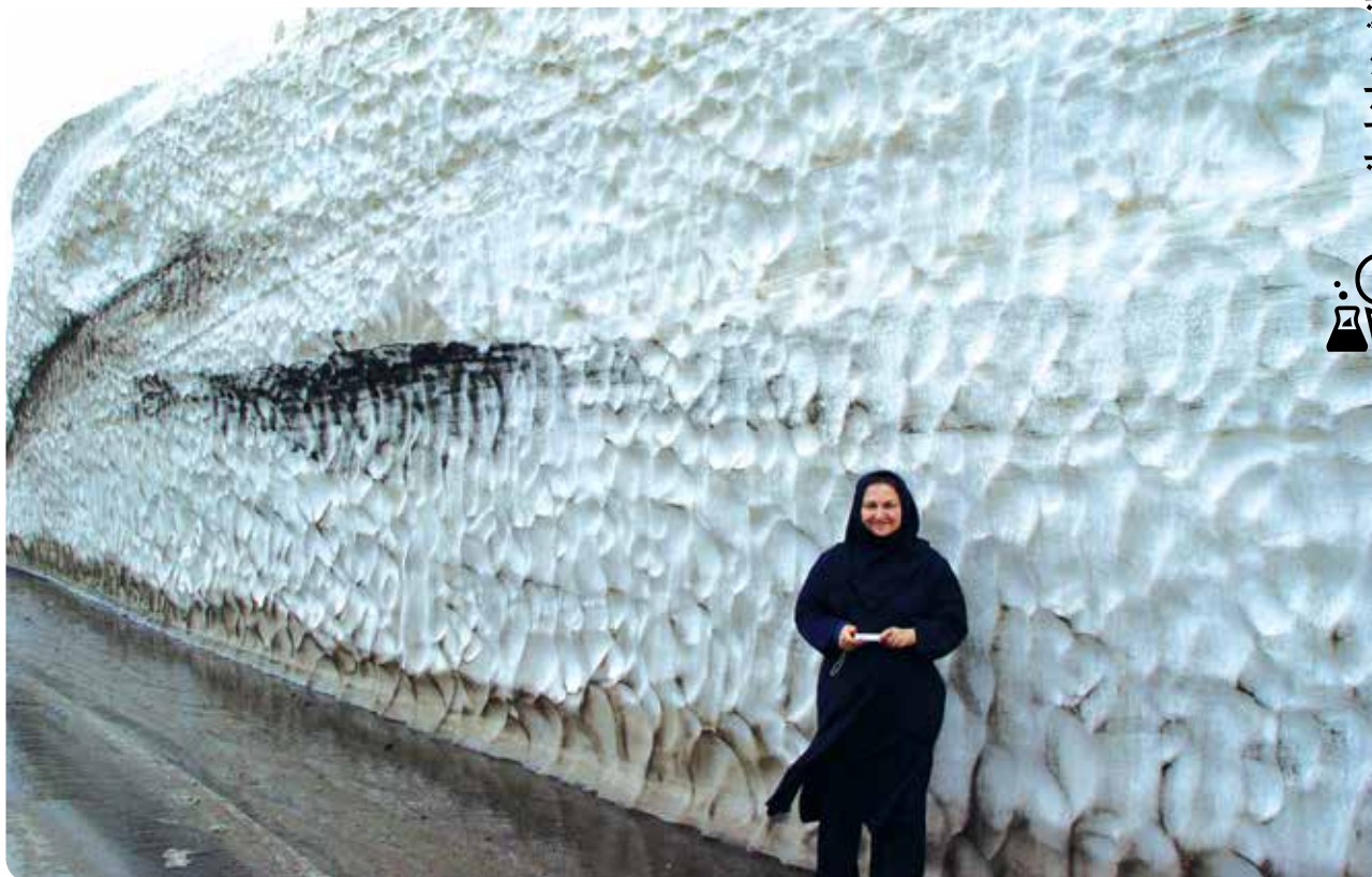
مأموریت جمع‌آوری گیاه از مسیر جاده بین کندوان و هراز، آذر ۱۳۸۹ (ش)