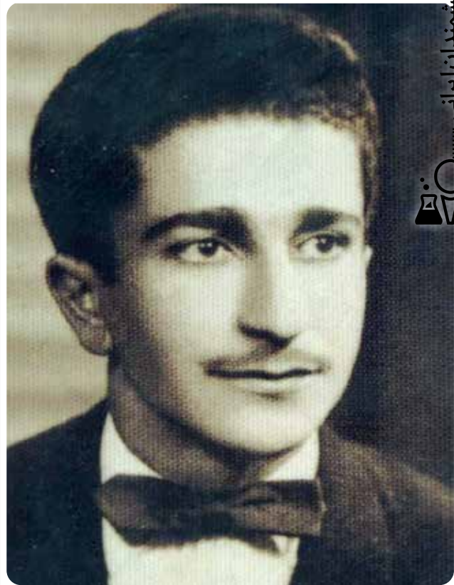
دکتر یخکشی در سال ۱۳۳۵

که ایشان را بنیان‌گذار رشته مهندسی محیط‌زیست در ایران می‌دانند. همچنین، به واسطه تخصصی که در تحصیلات عالی خود در دانشگاه گوتینگن آلمان کسب نمودند، کتاب‌ها و مقالات متعددی را در زمینه سیاست منابع طبیعی و مسائل اجتماعی و اقتصادی با تأکید بر نقش مسائل اجتماعی و اقتصادی در مدیریت پایدار منابع طبیعی و نیز پارک‌های طبیعی به رشته تحریر درآوردند که خود منشأ مؤثری در توجه مجامع علمی و دستگاه‌های اجرایی به این موضوعات مهم بوده است. از سوی دیگر مقالات، سخنرانی‌ها و نوع نگاه ایشان در سطح بین‌الملل نیز مورد توجه بوده است، به طوری که برخی کشورها استفاده از این تفکر در مدیریت منابع طبیعی را در سیاست‌ها و اقدامات خود مد نظر قرار داده‌اند. زمانی که ایشان در ایران حضور داشتند، در ملاقات و مصاحبه‌ای حضوری، اجازه تدوین زندگینامه ایشان اخذ شد، بخشی از مطالب، برگرفته از این مصاحبه با استاد گرامی است.