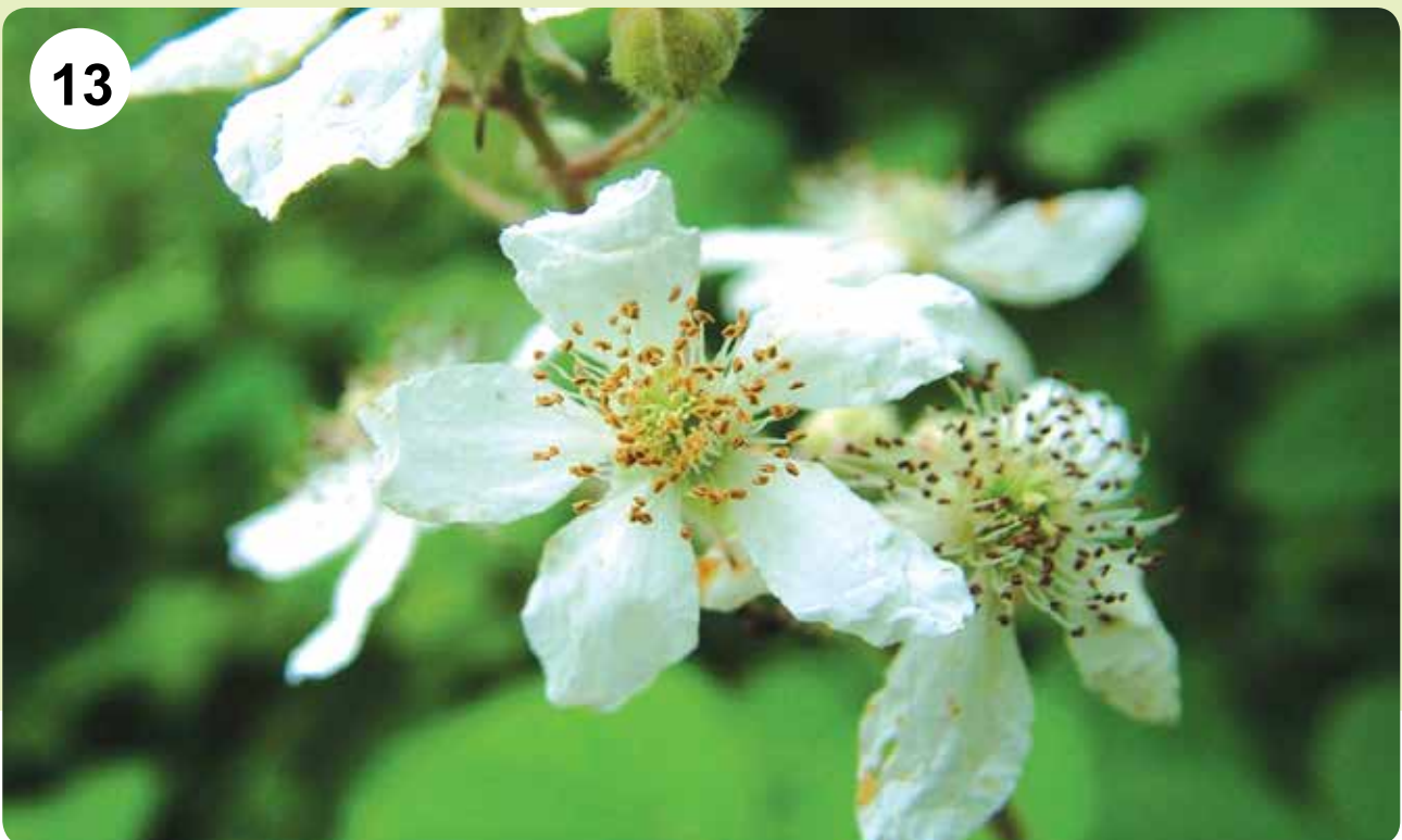
شکل‌های ۱۱-۱۳- گل Rosa beggeriana (۱۱)، فرم رویشی Rosa foetida (۱۲) و گل گوندای تمشک ( Rubus sp.) (۱۳)

C. microcarpa , C. pseudoprostrata , Alchemilla fluminea , A. retinervis , hyrcana , P. turcomanica , Fragaria vesca , F. viridis , Filipendula ulmaria subsp. denudate , Potentilla bungei , P. meyeri , P. micrantha , Prunus divaricate subsp. caspica , P. spinosa , Rubus discolor , R. dolichocarus , R. hyrcanus , R. hirtus , R. persicus , Sanguisorba officinalis , Sibbaldia parviflora , Sorbus aucuparia , Sorbus torminalis . بعضی دیگر فقط در ناحیه ایرانی- تورانی، یا زاگرس پراکنده‌اند C. esfandiarii , C. hissarius , C. integerrimus , C. kotschyi , C. luristanicus , C. melanocarpus , C. morulus , C. nummularioides , C. nummularius , C. persicus , C. schrengeri , Crataegus aronia , C. atrosanguinea , C. curvisepala , C. aminii , C. assadii , C. davisii , C. kurdistanica , C. orientalis , C. persica , C. pontica , C. pseudoheterophylla , C. sakranensis , C. Alchemilla fluminea , A. kurδικa , Amygdalus arabica , A. brahuica , A. carduchorum , A. communis , A. eburnea , A. elaeagnifolia , A. erioclada , A. fenzliana , A. glauca , A. haussknechtii , A. korshinskyi , A. kotschyi , A. lycioides , A. nairica , A. orientalis , A. paboti , A. reticulata , A. scoparia , A. spinosissima , A. trichamygdalus , Cerasus araxina , C. brachypetala , C. chorrassanica , C. incana , C. mahaleb ,