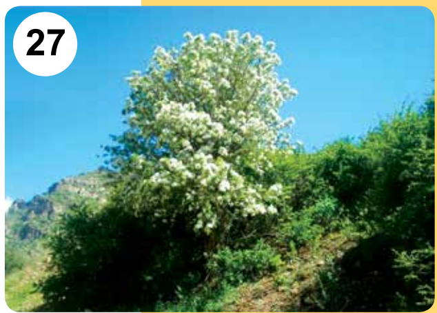
شکل‌های ۲۲-۲۷ - میوه Mespilus germanica (۲۲)، گل Malus orientalis (۲۳)، گل Cydonia oblonga (۲۴)، میوه Crataegus orientalis (۲۵)، میوه Pyrus boissieriana (۲۶) و فرم رویشی Pyrus syriaca (۲۷)

monogyna ، بیش از گونه‌های دیگر از نظر دارویی مورد استفاده و تحقیق قرار گرفته‌اند و همواره به‌عنوان استاندارد، شاهد و کنترل کیفیت به کار می‌روند (Liu et al., 2010). همچنین آثار آنتی‌اکسیدانی برگ و گل‌های Crataegus monogyna . C. oxyacan-