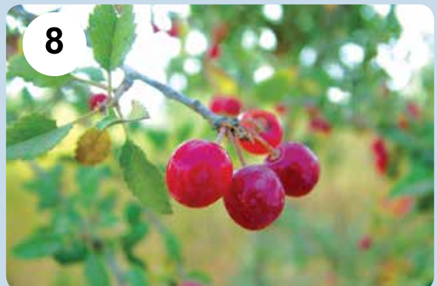
شکل‌های ۷-۸- گل Cerasus mahaleb (۷) و میوه C. microcarpa (۸)