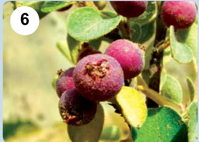
شکل‌های ۵-۶- میوه دو گونه شیرخشت Cotoneaster assadii (۵) و C. kotschy (۶)