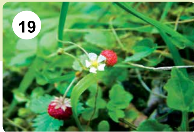
شکل‌های ۱۴-۱۹ - گل Agrimonia eupatoria (۱۴)، Filipendula vulgaris (۱۵)، Geum rivale (۱۶)، Geum urbanum (۱۷)، Potentilla argyroloma (۱۸) و Fragaria vesca (۱۹)

graeca , S. luristanica , S. persica . بعضی نیز در رشته‌کوه‌های البرز ناحیه ایرانی- تورانی حضور دارند مانند: Agrimonia eupatoria , Alchemilla amardiaca , A. caucasica , A. citrina , A. condensata , A. microscopia , A. pectiniloba , A. persica , A. plicatis- sima , A. sericata , A. surculosa , A. valdehirsuta , Amygdalus lycioides ,