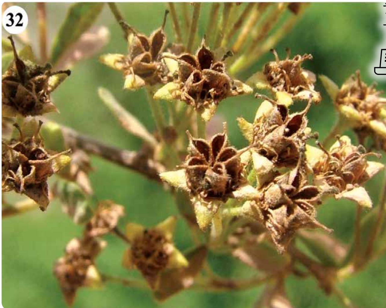
شکل ۳۲- میوه Spiraea sp. (۳۲)