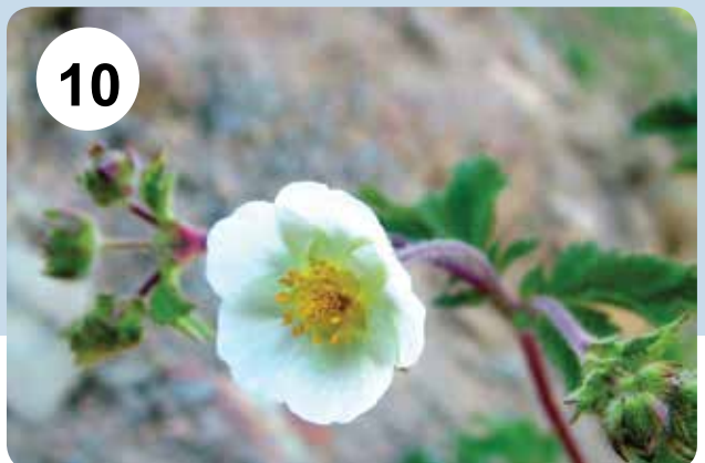
شکل‌های ۹-۱۰- گل Alchemilla persica (۹) و Drymocalis rupestris (۱۰)

Cerasus avium , Crataegus microphylla , C. pentagyna , Laurocerasus officinalis , Mespilus germanica , Padus avium , Potentilla crantzii , P. meyeri , P. rupestris , Pyrus boissieriana , P. grossheimii , P.