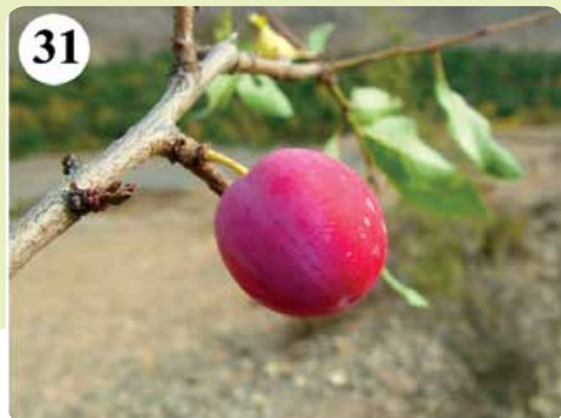
شکل‌های ۲۸-۳۲- فرم رویشی Amygdalus kamiaranensis (۲۸)، Amygdalus orazii (۲۹)، Amygdalus scoparia (۳۰)، میوه Prunus divaricata (۳۱).