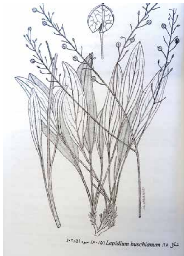
شکل ۲۸. Lepidium buschianum (۵/۰). میوه (۵/۰).