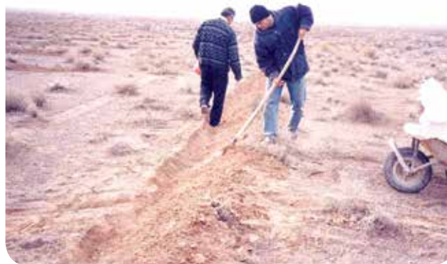
عکس ۲- اجرای عملیات اصلاح و احیاء در مراتع (مراتع قشلاقی استان البرز)