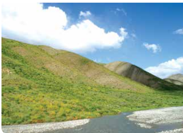
عکس ۱- طرح مرتع‌داری آزادبر از مراتع بیبلاقی استان البرز، سال ۱۳۹۱

هکتار مراتع طبیعی کشور که دامپروری ما بدان بستگی دارد، در معرض چرای بی‌رویه و نابودی است. حفظ، اصلاح و ازدیاد این مراتع مستلزم آن است که نوع علوفه و ارزش غذایی آنها، فصل چرا، ظرفیت مراتع، عادات محلی و سایر اوضاع و احوال بررسی شود