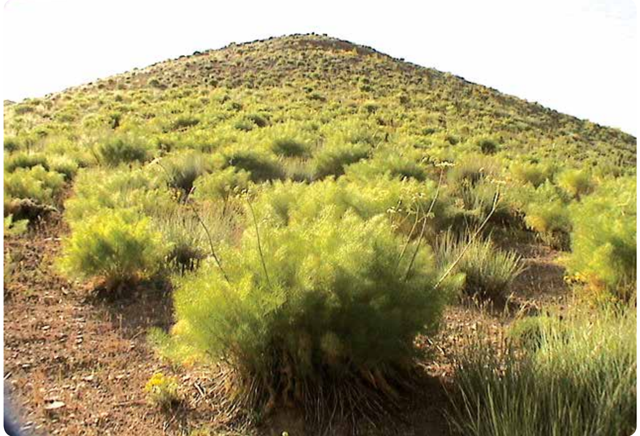
عکس ۴- طرح مرتعداری لارک از مراتع بیلاقی استان البرز (بوته‌های گیاه کزل Diplotaenia cachrydifolia )

بررسی ابلاغیه‌های متعدد در ارتباط با شرح خدمات و دستورالعمل طرح‌های مرتعداری، مؤید اعمال تغییرات شکلی و مختصر در آن بوده و ظاهراً این رویه به نوعی ابتکار مدیریتی برای هر مدیر جدید تبدیل شده است. این در حالی است که بررسی شرح خدمات طرح‌های مرتعداری از ابتدا تا آخرین ابلاغیه (دی ماه سال ۱۳۹۹) به وضوح