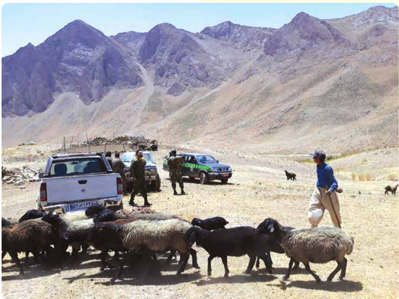
شکل ۳- حضور مأموران منابع طبیعی به منظور کنترل چرای دام براساس پروانه‌های چرای صادره

ه) ضوابط ممیزی و بهره‌برداری از مراتع، سال ۱۳۹۵ با توجه به نیازی که برای بازنگری و به‌روزرسانی دستورالعمل ممیزی مراتع احساس می‌شد، مجدداً در سال ۱۳۹۵ دستورالعمل ممیزی مراتع با اعمال تغییراتی، ابلاغ شد و عنوان آن به «شیوه‌نامه فنی و اجرایی ضوابط و شرایط بهره‌برداری از مراتع کشور» تغییر نمود. شیوه‌نامه مذکور، دارای سه فصل، ۹۳ بند و ۶۷ تبصره است. در این شیوه‌نامه، فصل اول با عنوان تعاریف، دارای ۲۴ بند و ۲ تبصره است که در آن برخی از عبارات و واژه‌ها تعریف شده است. فصل دوم که به پنج قسمت تقسیم شده، در مجموع ۵۳ بند و ۶۲ تبصره دارد و فصل سوم با عنوان شرایط ابطال پروانه چرای دام، دارای ۱۶ بند و ۳ تبصره است. بخش‌های فصل دوم عبارتند از: شرایط عمومی با