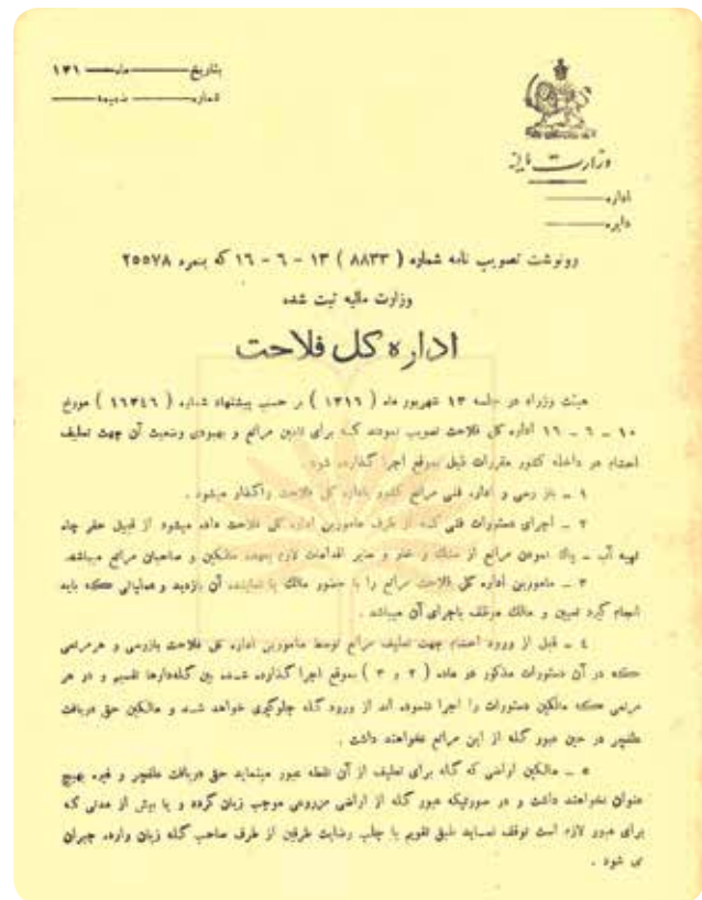
شکل ۱- تصویب‌نامه اداره کل فلاح و وزارت مالیه برای چرای احشام در مراتع در سال ۱۳۱۶