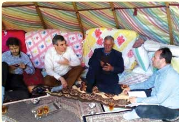
شکل ۲- مصاحبه میزان رضایت‌مندی از اجاره‌دهی مراتع ( بیلاقات آلوارس سرعین)

مقولات راهبردی نیز از نظر آنها عبارتند از: منطقی شدن هزینه اجاره‌ها از سوی دولت، به رسمیت شناختن اجاره‌دهی مراتع، حل مشکلات قانونی اجاره مراتع توسط عشایر تک‌قطبی، ابطال پروانه اجاره‌دهندگان و انتقال آن به دامداران بدون پروانه، کنترل دولتی اجاره‌دهی، ضرورت گزارش‌دهی و تجدید ممیزی برای حذف اجاره‌دهندگان. موضوع مرکزی و مهم این بررسی پدیده «اجاره به خودی» بود، به عبارت دیگر،