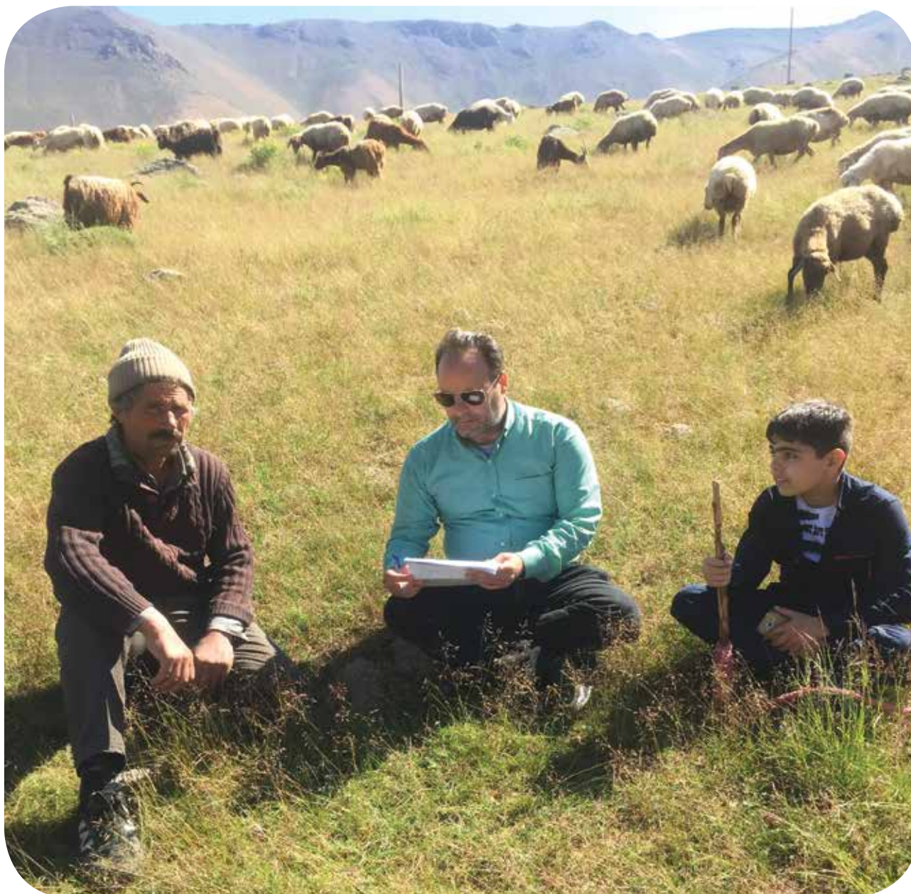
شکل ۳- مصاحبه میزان رضایت‌مندی از اجاره‌دهی مراتع (بیلاقات دامنه‌های شمالی سیلان)

مؤسسه تحقیقات جنگلها و مراتع کشور، تهران، ۷ صفحه. بی‌نام، ۱۳۹۵. شیوه‌نامه فنی و اجرایی ضوابط و شرایط بهره‌برداری از مراتع کشور. دفتر امور مراتع، سازمان جنگل‌ها، مراتع و آبخیزداری کشور، تهران، ۱۸ صفحه.