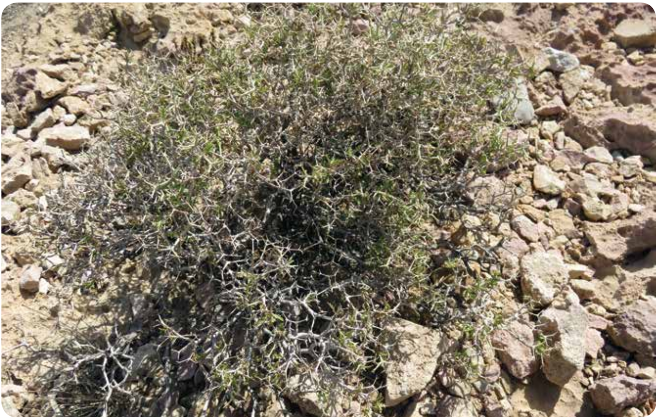
شکل ۷- گونه Pterocephalus wendelboi در منطقه گنو