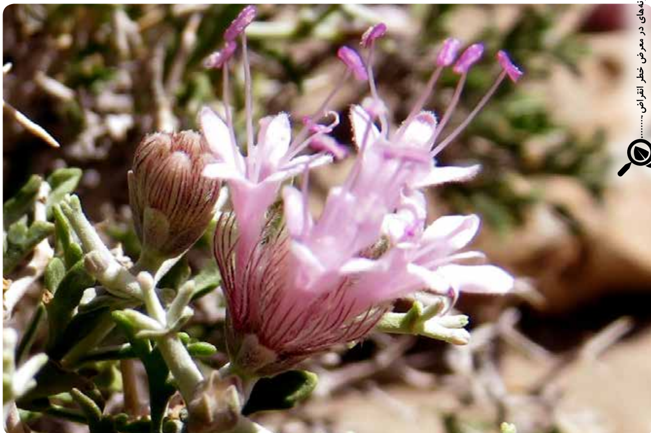
شکل ۳- شاخه گل‌دهنده با گل‌های مجتمع Pteroccephalus wendelboi