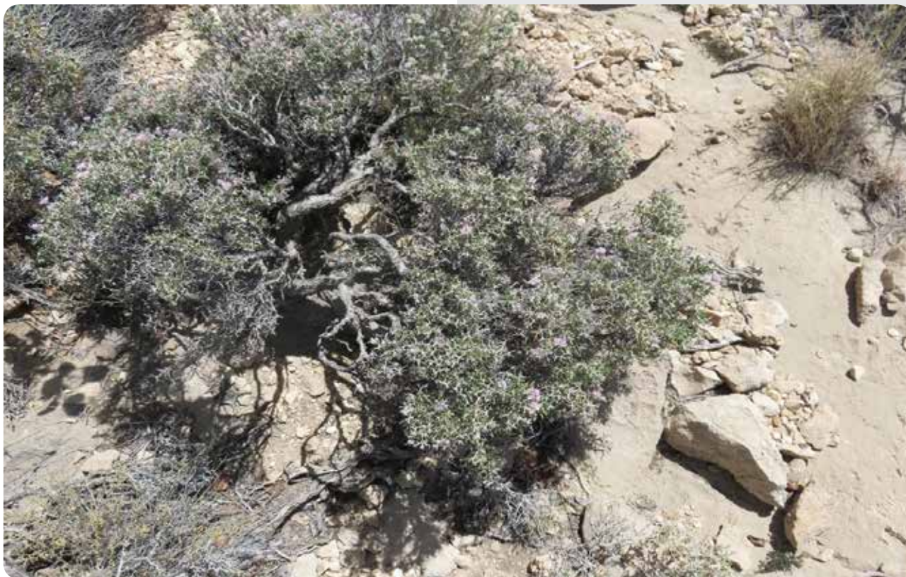
شکل ۸- رویشگاه گونه Pterocephalus wendelboi در منطقه بستک