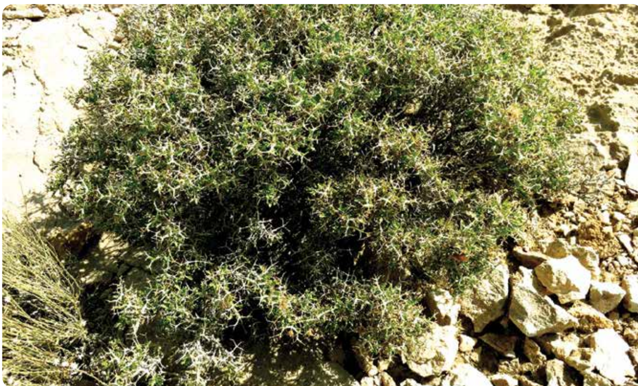
شکل ۱- فرم رویشی درختچه‌ای - بوته‌ای Pterocephalus wendelboi