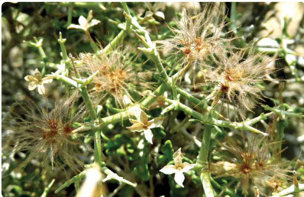
شکل ۴- کاسه‌های پرزدار در زمان میوه‌دهی Pteroccephalus wendelboi