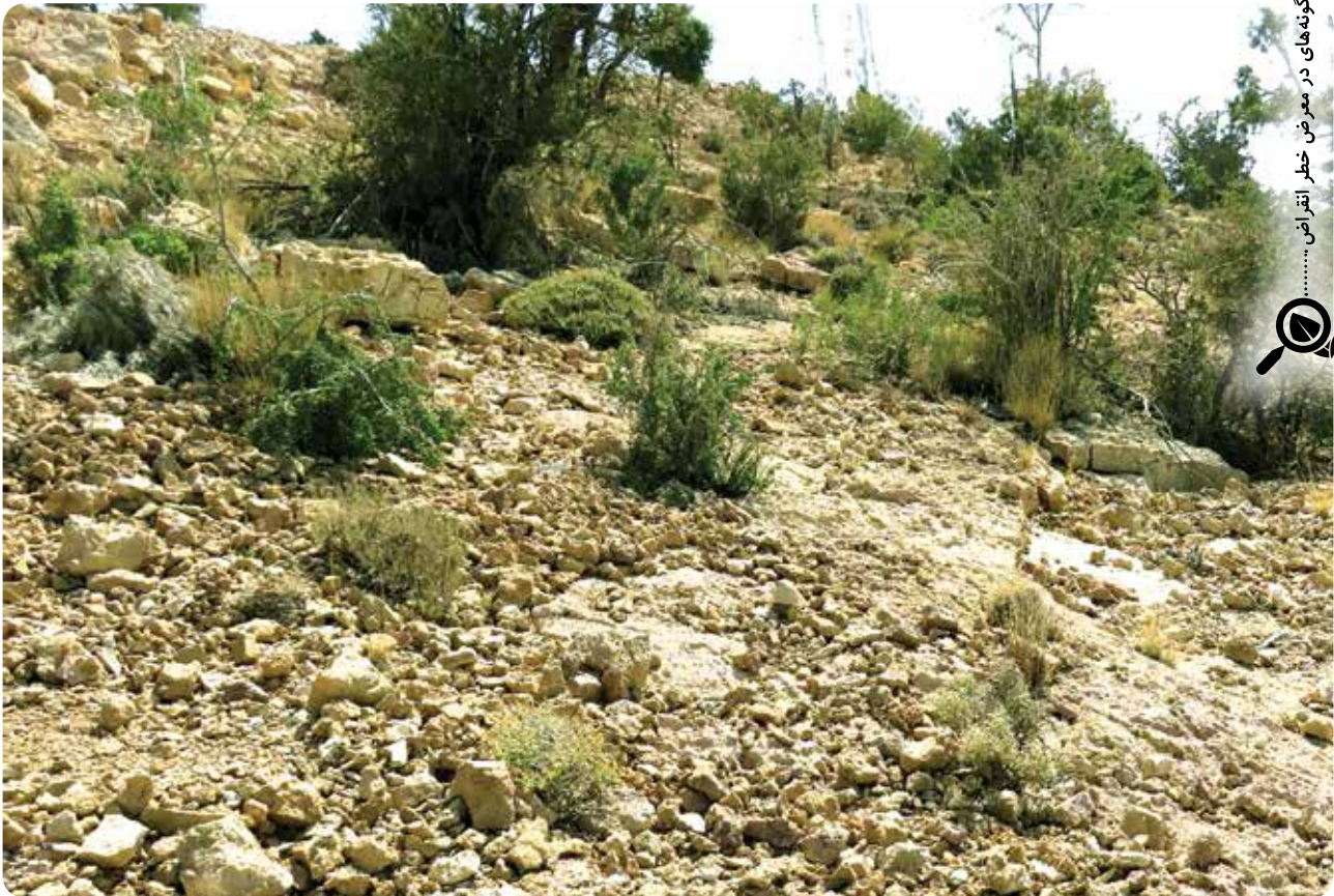
شکل ۶- رویشگاه سنگلاخی گونه Pterocephalus wendelboi در منطقه گنو