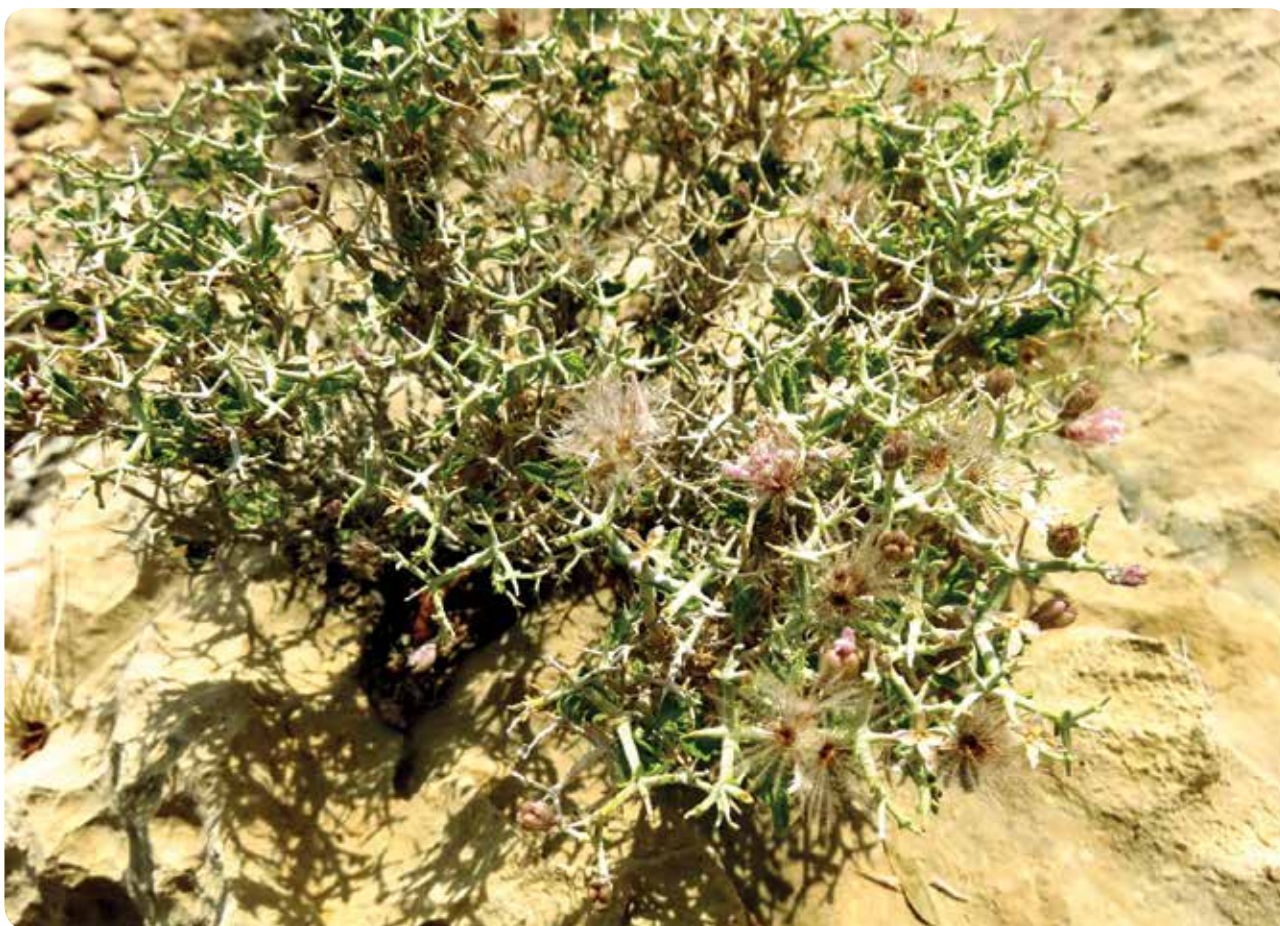
شکل ۲- گونه Pterocephalus wendelboi