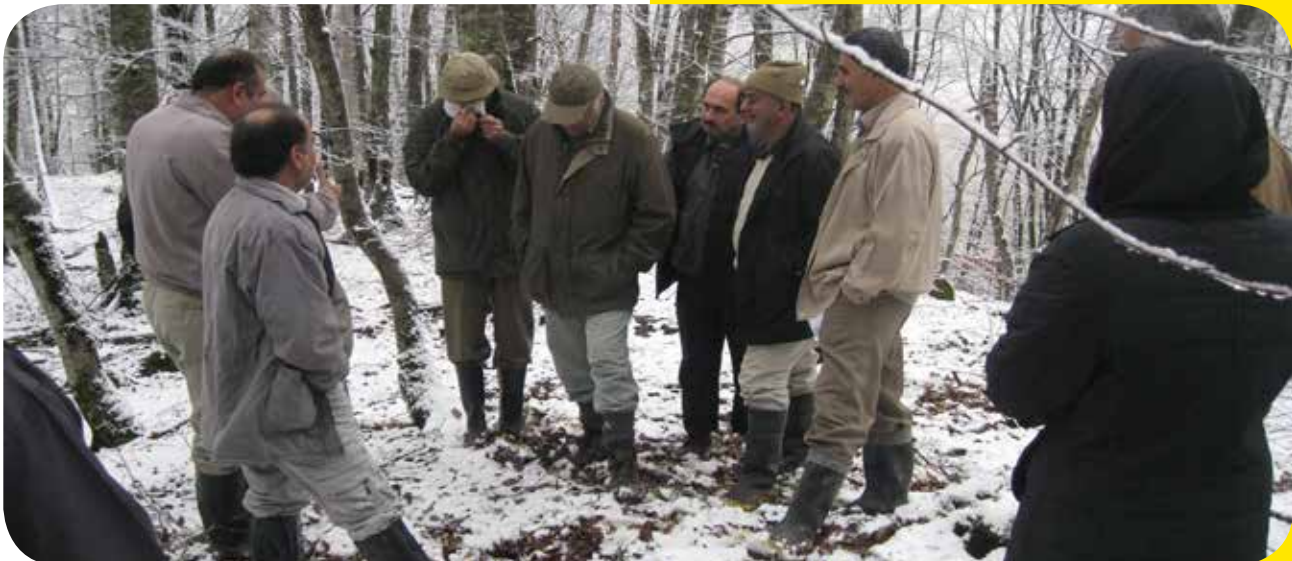
بازدید نشانه‌گذاری در طرح جنگل‌داری تیلیم؛ مازندران، سوادکوه

◀ همایش ملی مدیریت جنگل‌های شمال و توسعه پایدار (رامسر،