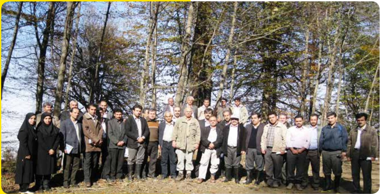
حضور در جنگل به همراه کارشناسان بخش اجرا در دوره‌های آموزشی، سال ۱۳۸۸