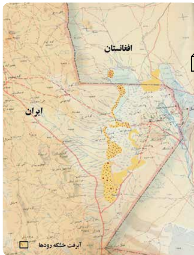
شکل ۲- اراضی حساس به فرسایش بادی در هامون‌های سیستان

Wolfe, S.A. and Nickling, W.G. 1993. The protective role of sparse vegetation in wind erosion. Progress in Physical Geography , 17: 50-50.