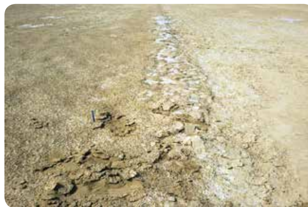
شکل ۴- نقش سله سطحی در کاهش تولید ریزگرد، کانون جنوب شرق اهواز