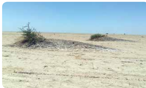
شکل ۳- نقش پوشش گیاهی در کنترل فرسایش بادی، هورشاه‌حمزه، کانون ریزگرد ماهشهر- هندیجان