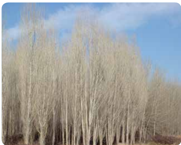
شکل ۲- نمایی از صنوبرکاری‌های سنتی با فاصله کاشت کم در استان کرمانشاه با گونه نیگرا، زمستان ۹۵