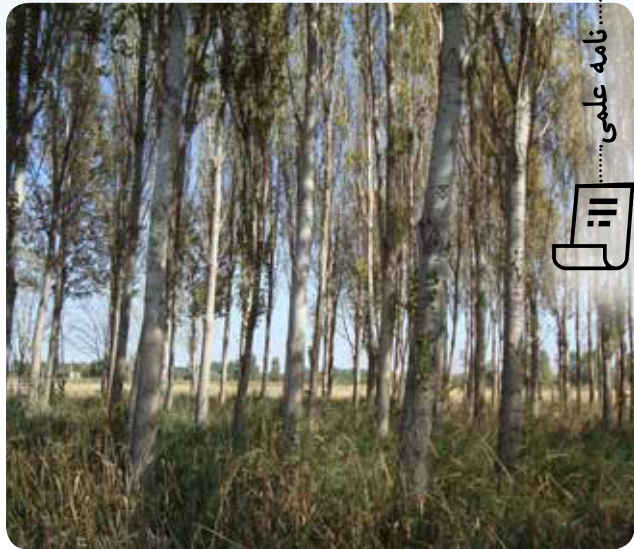
شکل ۸- کلکسیون پایه مادری صنوبر (پوپولتوم حفاظتی) در ایستگاه تحقیقات صنوبر ساعتلو ارومیه - ۱۴ ساله