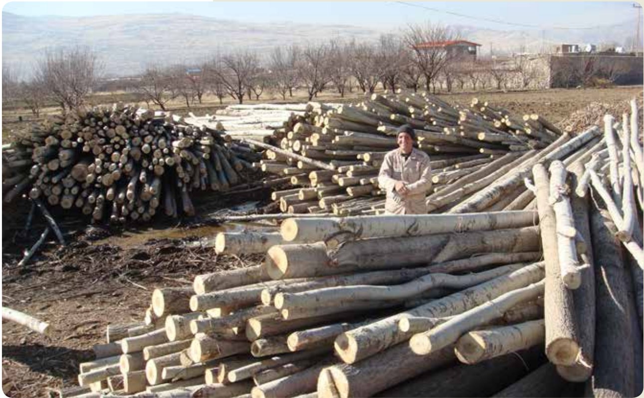
شکل ۳- بازار سنتی فروش چوب صنوبر (آلبا و نیگرا) در استان کرمانشاه، زمستان ۹۵

چوب صنوبر در استان کرمانشاه نشان داده می‌شود. ۲- استان کردستان