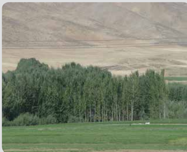
شکل ۶- صنوبرکاری‌های سنتی با گونه نیگرا در استان کردستان