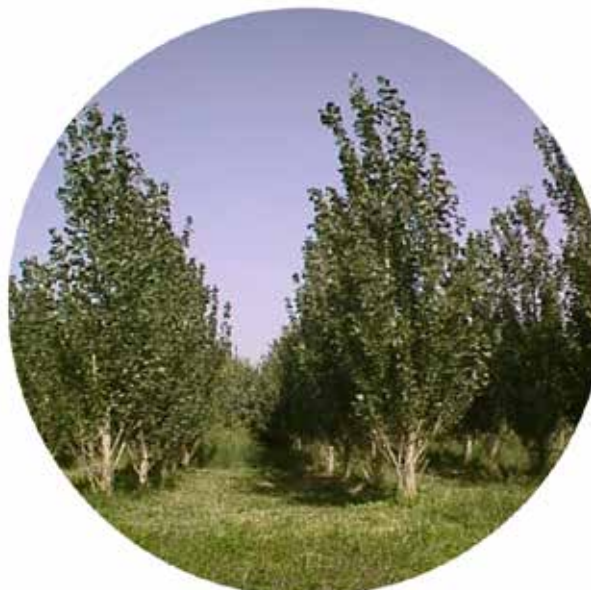
شکل ۵- نمایی از کلن‌های صنوبر تاج‌بسته (سمت راست) و تاج‌باز (سمت چپ) در طرح تحقیقاتی سازگاری ارقام مختلف صنوبر، استان کردستان