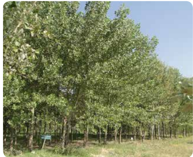
شکل ۱۰- طرح تحقیقاتی دورگ‌های بین پده و کبوده، ۸ ساله در ایستگاه رسول‌آباد میان‌دوآب آذربایجان غربی