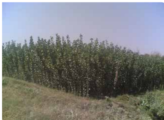
شکل ۴- نمایی از خزانه (سمت راست) و کلکسیون (سمت چپ) در طرح تحقیقاتی سازگاری ارقام مختلف صنوبر، استان کردستان، ایستگاه تحقیقات کشاورزی گریزه