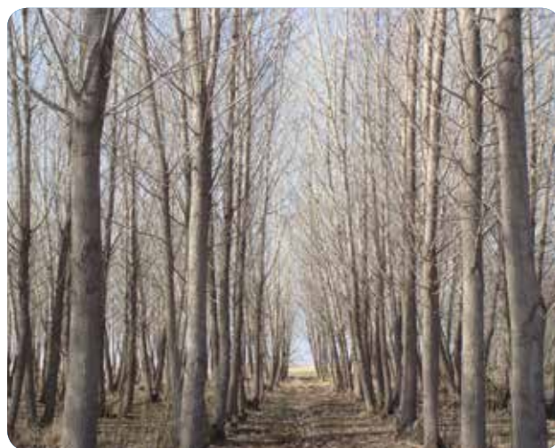
شکل ۱- نمایی از درختان طرح تحقیقاتی سازگاری ارقام مختلف صنوبر، ایستگاه تحقیقاتی مهرگان، زمستان ۹۵