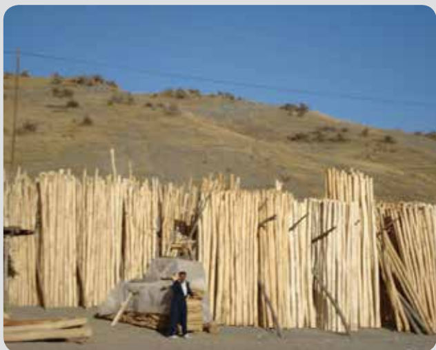
شکل ۷- بازار سنتی فروش چوب صنوبر در مریوان