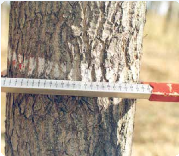
شکل ۹- رشد قطری ۲۶/۵ سانتی متری کلن P. e . ۴۸۸ و مشخص بودن شیارهای روی تنه