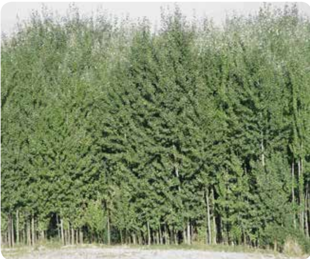
شکل ۱۱- صنوبرکاری‌های سنتی با گونه P. alba ، میان‌دوآب، آذربایجان غربی