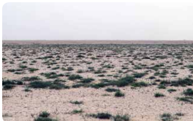
شکل ۳- رویش‌های نم‌پسند Aeluropus lagopoides در اطراف تالاب منصوره و شریفه