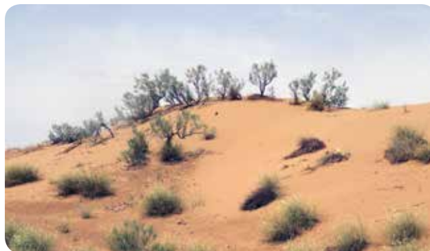
شکل ۷- رویش‌های شن‌دوست Pennisetum divisum , Calligonum intertextum در اطراف بستان