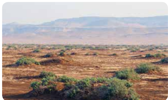
شکل ۶- رویشگاه گیاهان شورپسند خشکی‌زی Seidlitzia rosmarinus , Suaeda vermiculata با توان بالای نگهداری خاک