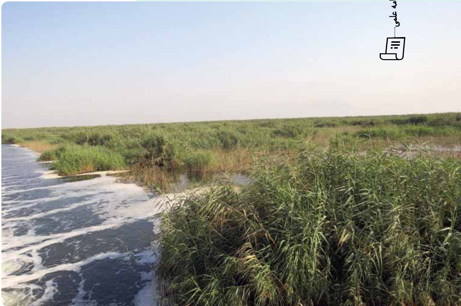
شکل ۲- تالاب هورالعظیم ( Phragmites australis )

مشخص شد. برای بررسی صحت و دقت واحدهای تعیین شده شبکه‌ای به فاصله ۱۰۰۰ متر از هم به‌طور تصادفی روی نقشه منطقه طراحی شد که دارای مشخصات جغرافیایی معینی بود. برای مطالعه میدانی با کمک دستگاه GPS، محل دقیق نقاط شبکه روی زمین معین شد. با شناسایی گونه‌های گیاهی غالب، تیپ‌های گیاهی به تفکیک نام‌گذاری شد (مظفریان، ۱۳۷۸؛ دیناروند و شریفی، ۱۳۸۷؛ دیناروند و جم‌زاد، ۱۳۹۴؛ اسدی و همکاران، ۱۳۹۶-۱۳۶۷؛ Rechinger (ed), 1963-2000).