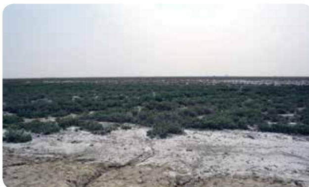
شکل ۵- رویشگاه گیاه شورپسند Halocnemum srtobilaceum در اطراف نهر مالح