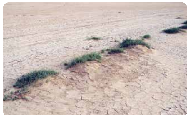
شکل ۴- رویش‌های خطی نم‌پسند در محل‌های ذخیره آب در زمستان

در نقاط این دشت حضور یابند که سیمای مختلفی را با توجه به شرایط محیطی دارا هستند. پوشش گیاهی منطقه شامل چهار تپ رویشی گیاهان تالابی، نم‌پسندان شورروی، گیاهان شورپسند خشکی‌زی و گیاهان مناطق شنی و شن‌دوست است (شکل‌های ۲ تا ۷). البته در مناطق روستایی و حاشیه مزارع یا مناطق صنعتی موجود در منطقه تعدادی درخت و درختچه کاشته شده و سازگار