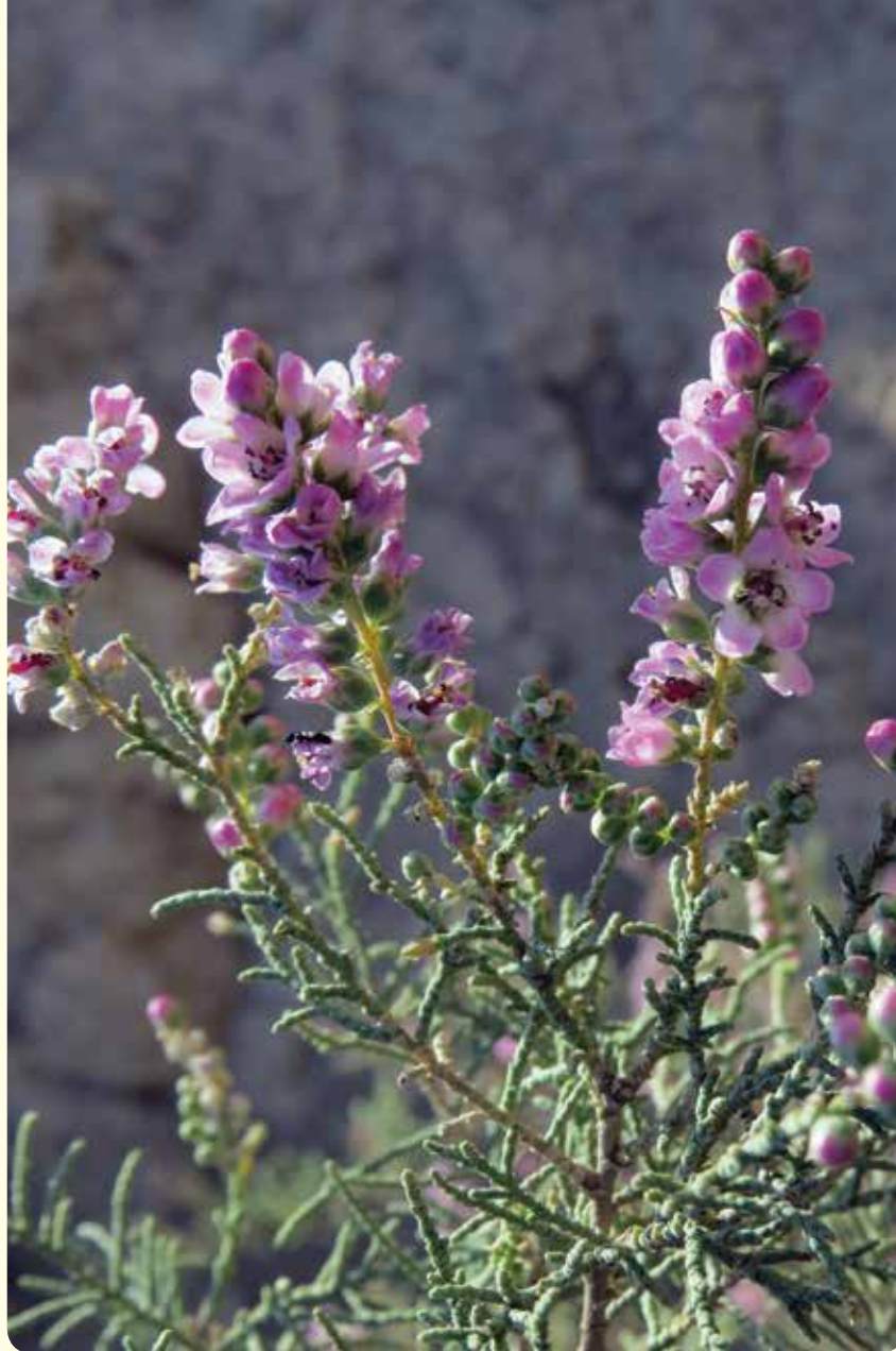
شکل ۱۱- گونه شورگژ محلی Tamarix passerinoides

ازدری، ع.، حیدریان، پ.، جودکی، م.، درویشی خاتونی، ج. و شهبازی، ر.، ۱۳۹۴. شناسایی کانون‌های منشأ ریزگرد در استان خوزستان. سازمان زمین‌شناسی و اکتشافات معدنی کشور، اداره‌کل زمین‌شناسی و اکتشافات معدنی منطقه جنوب باختری (اهواز). اسدی، م.، معصومی، ع.الف.، خاتم‌ساز، م.، مظفریان و جم‌زاد، ز.، ۹۶-۱۳۶۷. فلور ایران. انتشارات مؤسسه تحقیقات جنگلها و مراتع کشور، تهران. جم‌زاد، ز.، ۱۳۸۷. برنامه راهبردی تحقیقات گیاه‌شناسی و رده‌بندی گیاهان در محیط‌های طبیعی ایران. مؤسسه تحقیقات جنگلها و مراتع کشور، تهران. ۲۷۴ صفحه. درگاهیان، ف.، لطفی‌نسب اصل، س.، خسروشاهی، م. و گوهردوست، آ.، ۱۳۹۶. تعیین سهم منابع داخلی و خارجی گردوغبار در خوزستان. نشریه طبیعت ایران، ۲(۵): ۳۶-۴۱. دیناروند، م. و شریفی، م.، ۱۳۸۷. نگرشی بر زیستگاه‌های جنوب غرب کشور (استان خوزستان). مجله پژوهش‌های منابع طبیعی (پژوهش و سازندگی) شماره ۸۱: ۸۶-۷۷. دیناروند، م. و جم‌زاد، ز.، ۱۳۹۴. گزارش نهایی طرح شناسایی نمونه‌های گیاهی هرباریوم استان خوزستان. مؤسسه تحقیقات جنگلها و مراتع کشور، ۲۰۹ صفحه. دیناروند، م.، اجتهادی، ح.، فرزام، م. و اندرزیان، ب.، ۱۳۹۵. بررسی اثر عوامل محیطی بر تنوع زیستی و مدل‌سازی تأثیر تغییر اقلیم بر برخی گونه‌های گیاهی در منطقه