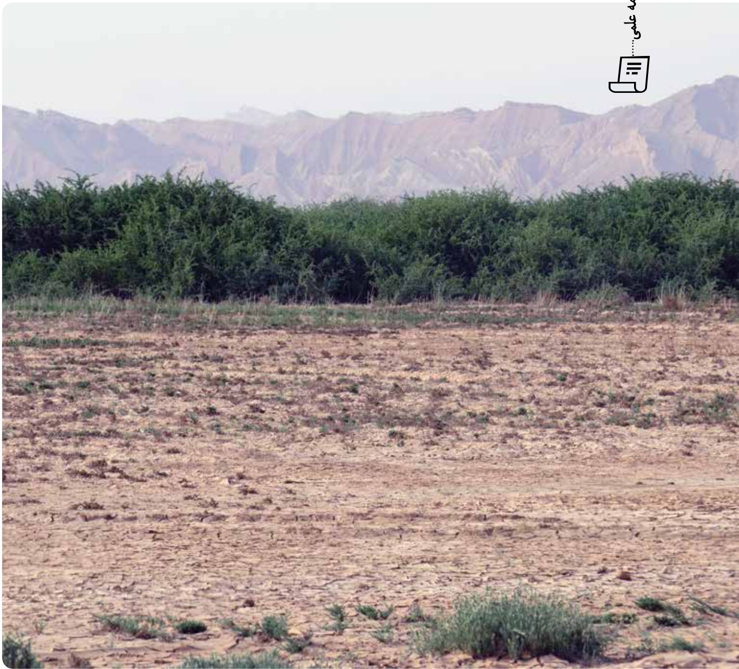
شکل ۱۳- تکثیر غیر جنسی گونه سریم Lycium depressum و ایجاد دیواری سبز در منطقه

Rechinger, K. H. 1963-2000: Flora Iranica vols. 1-176, Graz, Austria. Varoujan, K. S. Nadhir, A. A. and Sven, K. 2013. Sand and dust storm events in Iraq. Natural Science . 5 (10): 1084-1094. Xulai, K. Zou and Panmao, M. Zhai. 2004. Relationship between vegetation coverage and spring dust storms over northern China. Journal of Geophysical research . 109: 1-9.