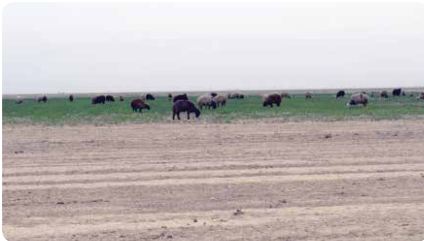
شکل ۹- چرای دام در مزارع کشاورزی رهاشده به دلیل کمبود آب