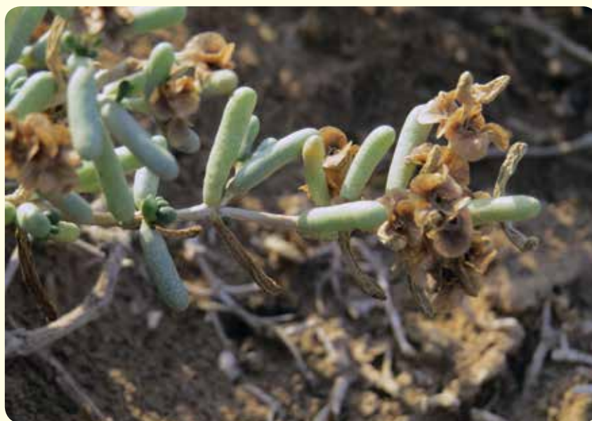
شکل ۱۲- گیاه اشنان Seidlitzia rosmarinus گونه‌ای خودرو در منطقه، با اندام‌های گوشتی و میوه فندقه