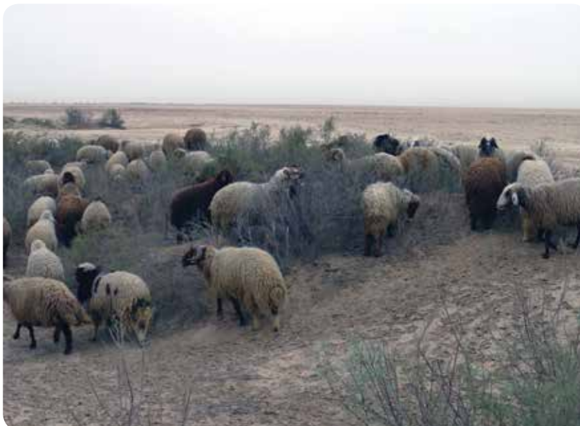
شکل ۱۰- چرای درختچه‌های گز در مرکز کانون گردوغبار در شرق اهواز