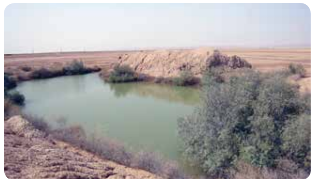
شکل ۸- گودال‌های ذخیره نزولات جوی و نگهداری آب و رویش گونه‌های گیاهی مانند گز