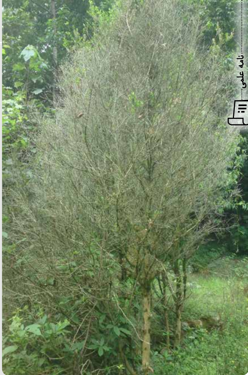
شکل ۲- شمشاد مورد تهاجم قرار گرفته توسط آفت شب‌پره شمشاد در پارک جنگلی دکتر دستکار (گیلان)

بخش‌های وسیعی از رویشگاه‌های شمشاد، جمعیت‌های مختلف آن از تنوع قابل ملاحظه‌ای برخوردارند. تنوع در ویژگی‌های مختلف این گیاه احتمالاً به علت هتروزیگوزیتی ناشی از دگرگشتی در شمشاد است.