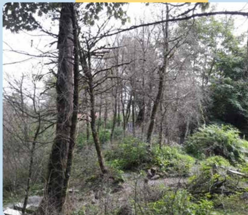
شکل ۱- شمشادهای آسیب‌دیده از بیماری بلایت در رویشگاه سمندکیش گیلان (سمت چپ) و پیرهرات گیلان (سمت راست)