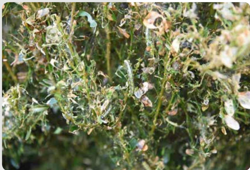
شکل ۳- شمشاد مورد تهاجم قرار گرفته توسط لاروهای آفت شب‌پره

تنوع و تمایز ژنتیکی جمعیت‌های شمشاد در مؤسسه تحقیقات جنگلها و مراتع کشور به وسیله مطالعه الگوی پروتئین‌های کل برگ درختان و پروتئین‌های ذخیره‌ای بذر درختان بررسی شد. در این پژوهش تنوع و تمایز جمعیت‌های شمشاد موجود و نیز جمعیت‌هایی که در آینده شکل خواهند گرفت (توسط نتاج بذری) برآورد شدند. به این ترتیب برگ درختان سالم و آلوده به‌عنوان نماینده جمعیت‌های شمشاد موجود و بذر درختان سالم به‌عنوان نماینده جمعیت‌های شمشاد آینده بررسی شدند. از آنجایی که فقط درختان سالم