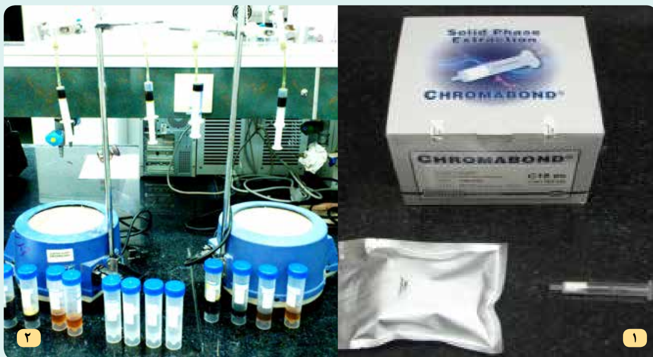
شکل ۲- ستون کروماتوگرافی C18 (۱) و نحوه جداسازی توسط ستون کروماتوگرافی (۲).

حدود ۶ درصد از گونه‌های گیاهی آزمایش شده قادر به سنتز اکدیستروئیدها هستند و تنها کمتر از ۲ درصد از گیاهان برای وجود این