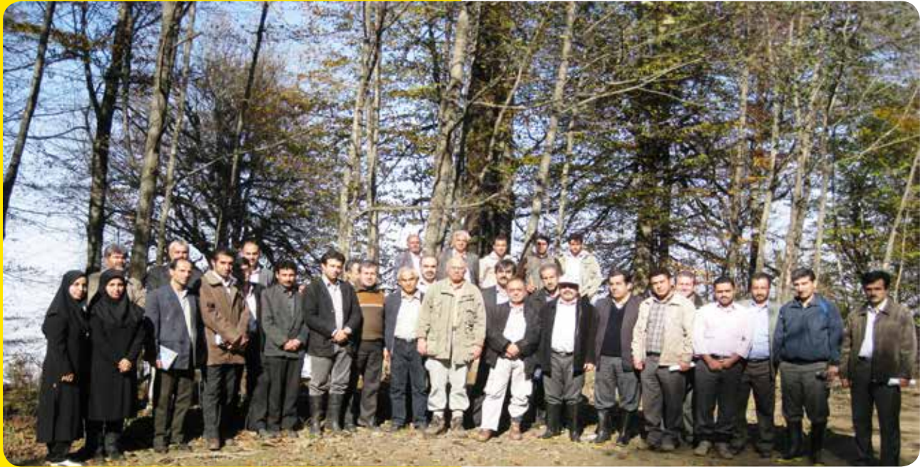
حضور در جنگل به همراه کارشناسان بخش اجرا در دوره‌های آموزشی، سال ۱۳۸۸