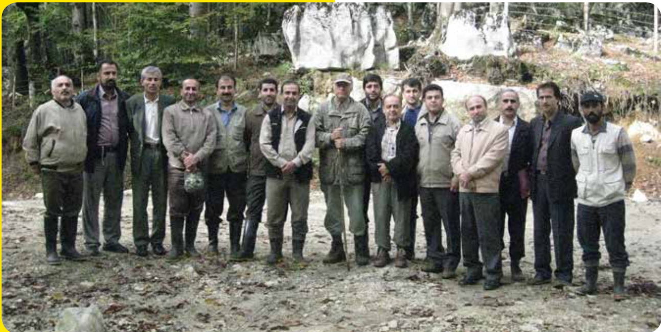
دوره آموزش و بازدید نشانه گذاری در جنگل های شمال کشور، مازندران، نو شهر سال ۱۳۸۸

ایشان در بازگشت به میهن و در تابستان ۱۳۷۲ دوره آموزشی جنگل شناسی پیشرفته را برای دانشجویان دوره دکتری دانشکده منابع طبیعی و علوم دریایی دانشگاه تربیت مدرس (نور) برگزار کرد. شاید نیاز جامعه و استقبال کم نظیر استادان و دانشجویان، فرایند ادامه کار در میهن را در ذهن ایشان تقویت کرد؛ امید است بحث های مطرح شده در این دوره، که گویا روی نوار کاست ضبط شده است، توسط آن دانشکده در اختیار جامعه علمی کشور قرار گیرد. همچنین دوره آموزشی دیگری در تابستان ۱۳۷۳ در چالوس برگزار شد که در آن دیدگاه جنگل شناسی نزدیک به طبیعت، برای ده ها نفر از مدیران و کارشناسان سازمان جنگل ها و مراتع کشور و سایر شرکت کنندگان در چالوس ارائه شد. این دیدگاه به علت مشکلات اجرای شیوه پناهی در جنگل های شمال کشور، بسیار مورد علاقه و استقبال کارشناسان اجرایی قرار گرفت و شرکت کنندگان در دوره فوق، آن را