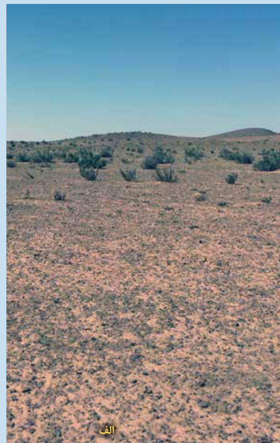
شکل ۱- مناطق مورد مطالعه تحت مدیریت چرای متفاوت (الف: چرای سنگین، ب: چرای مدیریت‌شده و ج: قرق)