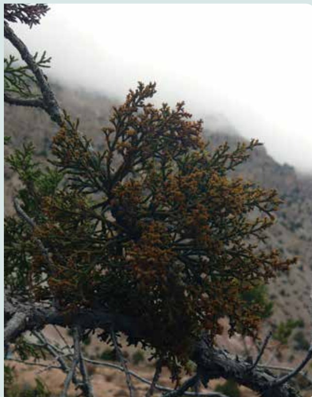
شکل ۴ - توده های به هم فشرده ارس و اش Arceuthobium oxycedri (D.C.) M. B. روی شاخه های درختان ارس Juniperus excelsa M. B. منطقه حفاظت شده پرور (جنوب شرق شه میرزا، سمنان)