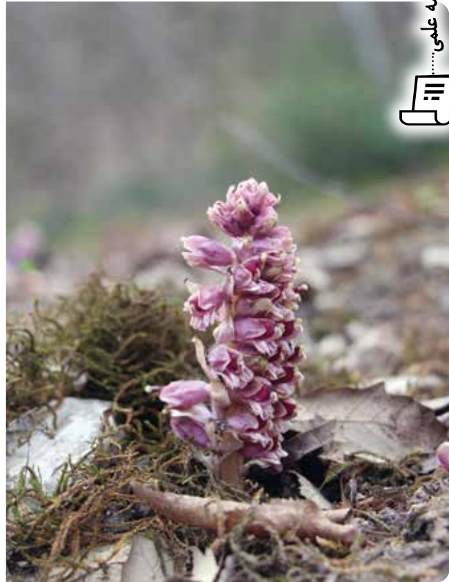
شکل ۲- Lathraea squamaria L. گونه‌ای از دسته هولوپارازیت‌ها و از تیره گل‌جالیز که در قسمت‌های میانی و کف جنگل‌های هیرکانی انتشار دارد.

روی درختان زیتون دیده می‌شود و گونه Arceuthobium minutissimum Hook.f. انگل درختان کاج هیمالیا ( Pinus griffithii Mc Clell.) است. برخی از انگل‌ها میزبان اختصاصی دارند مثل کولی کوتوله ( Arceuthobium douglasii Engelm) که تنها روی درختان دوگلاس ( Pseudotsuga spp.) زندگی می‌کند (Press & Graves, 1995).