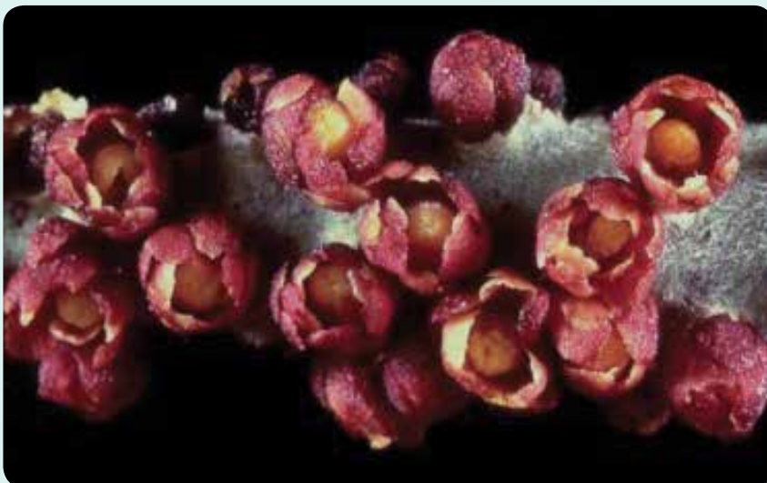
شکل ۹- گونه Pilostyles haussknechtii Boiss. یا گون واش از تیره Apodanthaceae که در غرب ایران، شیب‌های جنوبی البرز غربی تا حوالی تهران انتشار داشته و انگل بوته‌های گون است (Henning, 2008).

همان‌طور که در جدول شماره ۱ نشان داده شده است، تیره Orbanchaceae در ایران با تعداد ۱۲ جنس و ۷۱ گونه بزرگ‌ترین تیره گیاهان انگلی کشور به حساب می‌آید که شامل ۹ جنس با ۲۶ گونه نیمه‌انگلی و ۳ جنس با ۴۵ گونه انگلی است. در بررسی این تیره و در رابطه با پراکنش جغرافیایی، این جنس بیشترین دامنه انتشار را در بین سایر تیره‌ها و گونه‌های مربوطه، به