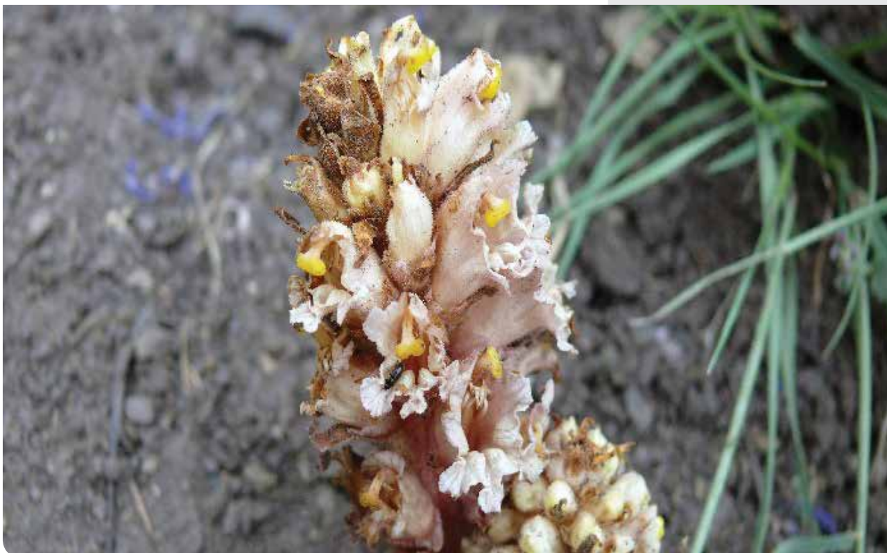
شکل ۷ - آشیانک یا Neottia nidus-avis (L.) L. C. Rich. از تیره ارکیدده، گیاهی بدون کلروفیل و مایکوهترتروفیک است. این گیاه، انگل قارچ‌هایی است که در کف جنگل یا روی تنه‌های ضعیف شده یا در حال فساد که زیر لاشبرگ و توده‌های لاشریزه جنگل پنهان هستند، می‌روید. در واقع میزبان آن یک قارچ است نه گیاه عالی (بالا). گونه‌های متعلق به جنس گل‌جالیز یا Orbach به‌عنوان گونه‌های انگلی اغلب روی ریشه گیاهان فعالیت دارند (پایین).