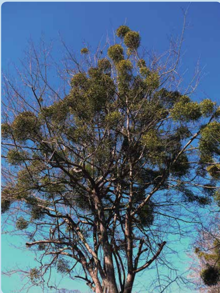
شکل ۱- گونه Viscum album L. از دسته گیاهان همی‌پارازیت با توانایی تولید کلروفیل

استفاده از توانایی انجام فتوسنتز چرخه رویشی و زایشی خود را تکمیل می‌کند. از سوی دیگر گیاهان انگلی معمولاً خسارت زیادی به مزارع، باغ‌ها و جنگل‌ها وارد می‌کنند. برخی آفت‌گونه‌های مهم کشاورزی هستند. تعدادی دیگر نیز باعث به خطر افتادن زندگی گیاهان نادر و در خطر انقراض، می‌شوند (Norton & Carpenter, 1998). هماهنگی بین ویژگی‌های فیزیکی و فیزیولوژیکی در یک گیاه انگلی به ماهیت بافت‌های آوندی آن بستگی دارد (Riopel & Timko, 1995; Hibberd & Jeschke, 2001). نهان‌دانگان انگلی بر اساس داشتن یا