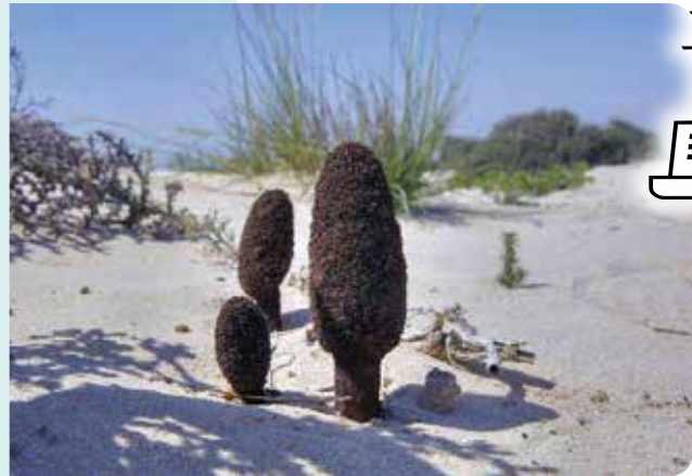
شکل ۸- گل قاضی یا خونین گرز، از خانواده Cynomoriaceae تنها یک گونه ( Cynomoriu coccineum L.) با دو زیر گونه شناسایی شده است که در شمال آفریقا و خاورمیانه پراکندگی دارند. گونه C. coccineum ssp. songaricum occurs در ایران و مغولستان پراکندگی دارد که هیچ گونه هم‌پوشانی با منطقه پراکنش زیر گونه اروپایی ( C. coccineum ssp. coccineum ) ندارد. (Henning, 2008).

تعداد گونه از گروه همی‌پارازیت‌های نیمه‌انگلی ایران هستند که در اغلب مناطق رویشی کشور انتشار دارند. در این رابطه در جدول ۲، فهرست فلوریستیک گیاهان انگلی ایران، در واقع جدولی به روز شده با آخرین تغییرات نام‌گذاری گیاهان مورد نظر به همراه معروف‌ترین مترادف‌های آنها همچنین مناطق انتشار گونه‌های مورد نظر با استفاده از منابع فلور ایرانیکا، فلور فارسی ایران و ژورنال‌های گیاه‌شناسی ایران و همچنین بازدیدهای میدانی و جمع‌آوری‌ها تهیه و ارائه شده است.