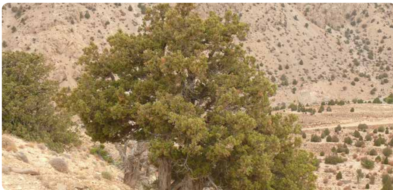
شکل ۱۱ - توده‌های جنگلی ارس در منطقه حفاظت‌شده پرور