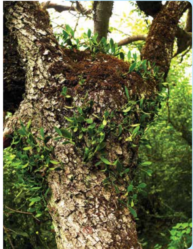
شکل ۳- نونهال‌های مستقر شده دارواش ( Viscum album L. ) روی تنه درخت کچف (راست). توده فشرده ارس‌واش ( Arceuthobium oxycedri ) روی شاخه‌های درختان ارس

حضور گیاه انگل باعث ایجاد تنش‌های مختلفی در گیاه میزبان می‌شود که مهم‌ترین آن تنش خشکی است. Bigler و همکاران (۲۰۰۶) اثر دارواش را بر مرگ ناشی از تنش خشکی ایجاد شده در درخت میزبان نشان دادند. تحقیقات مختلفی نیز در همین زمینه در ایران انجام شده است. براساس نتایج به‌دست آمده، در بیشتر موارد میزان فعالیت آنزیم‌های آنتی‌اکسیدان در گیاه آلوده به دارواش نسبت به گیاه غیر آلوده افزایش می‌یابد. با تعیین درصد آب موجود در برگ درخت میزبان آلوده، دیده شده که در مقایسه با برگ درخت غیر آلوده دارای درصد آب کمتری است. بنابراین حضور دارواش روی درخت میزبان و استفاده از منابع آبی میزبان، باعث ایجاد تنش کم‌آبی شده و در نتیجه آن، گیاه با افزایش فعالیت آنزیم‌های آنتی‌اکسیدانی با این تنش مقابله می‌کند (قربانلی و همکاران، ۱۳۹۱). اثر آلودگی Arceuthobium oxycedri روی گونه Juniperus excelsa در جنگل‌های شمال غرب ایران نیز مورد بررسی قرار