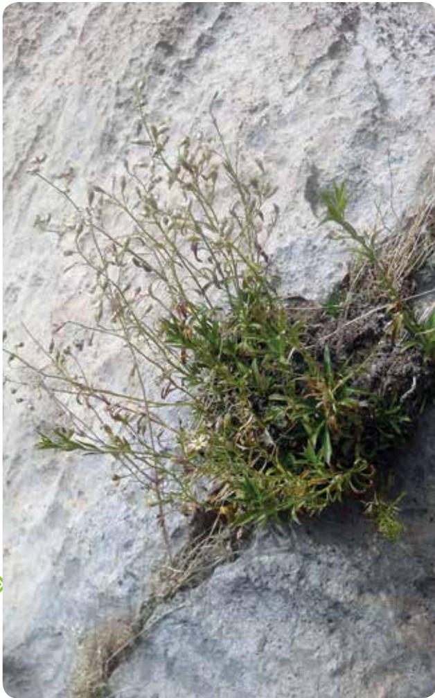
شکل ۴- نمای کاملی از گونه Silene parrowiana در مرحله میوه‌دهی