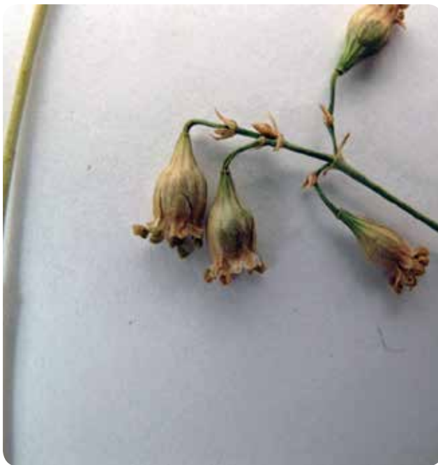
شکل ۶- میوه کپسولی در گونه Silene parrowiana