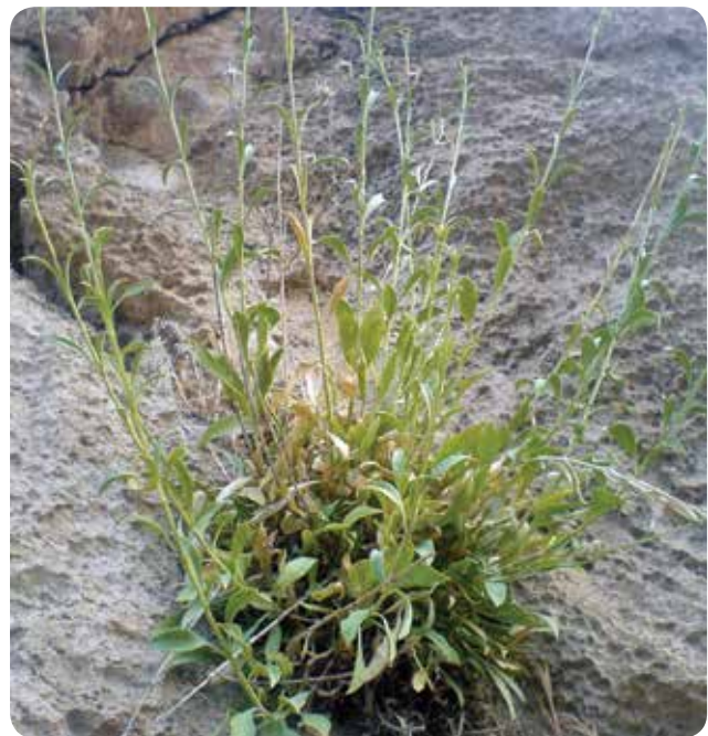
شکل ۵- شکل برگ‌های قاعده‌ای Silene parrowiana در رویشگاه صخره‌ای بیستون