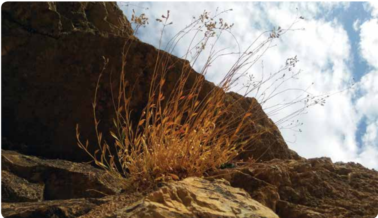
شکل ۲- رویشگاه دیواره‌های صخره‌ای Silene parrowiana در منطقه میان‌راهان