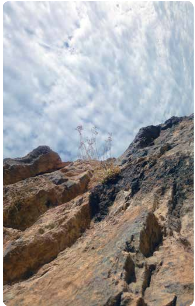
شکل ۳- رویشگاه دیواره‌های صخره‌ای Silene parrowiana در منطقه بیستون