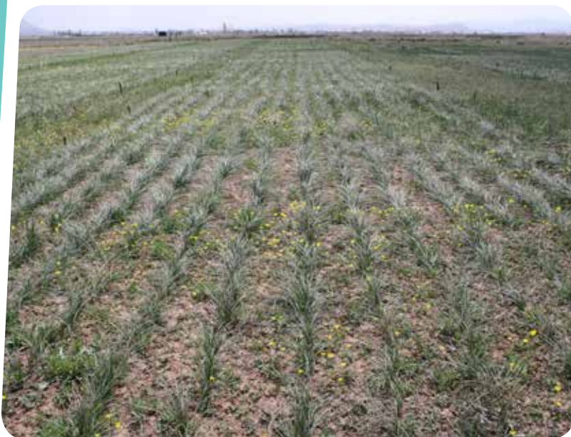
شکل ۸- مزرعه زعفران ( Crocus sativus ) در شرایط دیم، دماوند