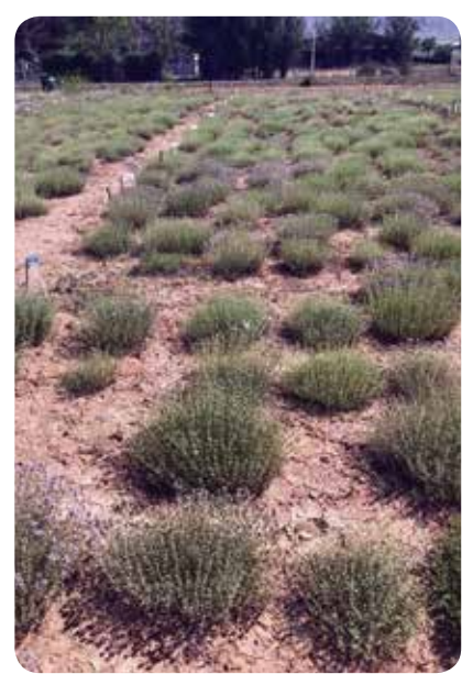
شکل ۷- مزرعه آویشن دنایی ( Thymus daenensis ) در شرایط دیم، دماوند