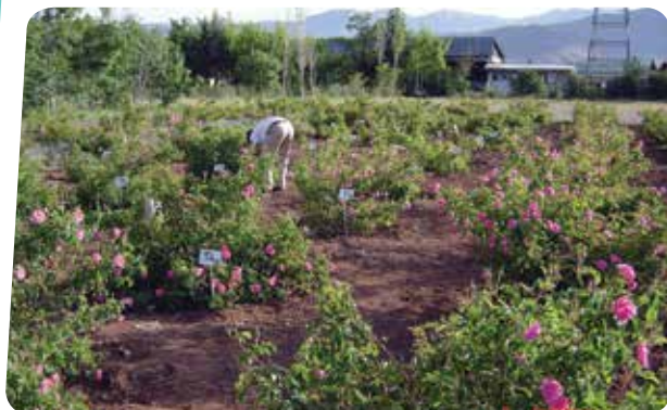
شکل ۱۰- مزرعه گل محمدی در شرایط دیم با اجرای مالچ