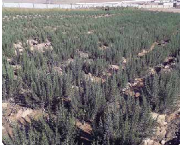
شکل ۳- مزرعه رزماری ( Rosmarinus officinalis ) در شهرکرد