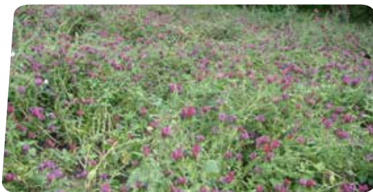
شکل ۶- مزرعه گل گاوزبان ( Echium amoenum ) در اشکورات