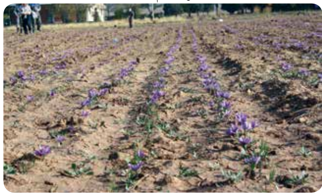
شکل ۹- گل‌دهی زعفران ( C. sativus ) در شرایط دیم، دماوند