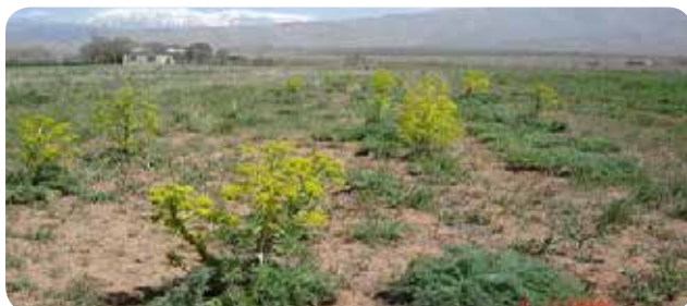
شکل ۵- مزرعه باریجه ( Ferula gommosa ) در شرایط دیم، دماوند