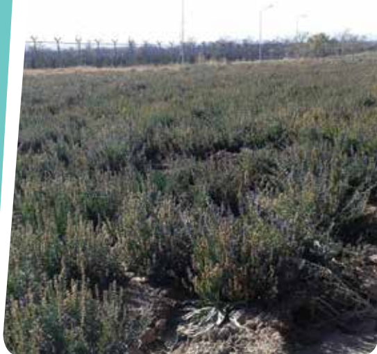
شکل ۴- مزرعه زوفا ( Hyssopus officinalis ) در شهرکرد