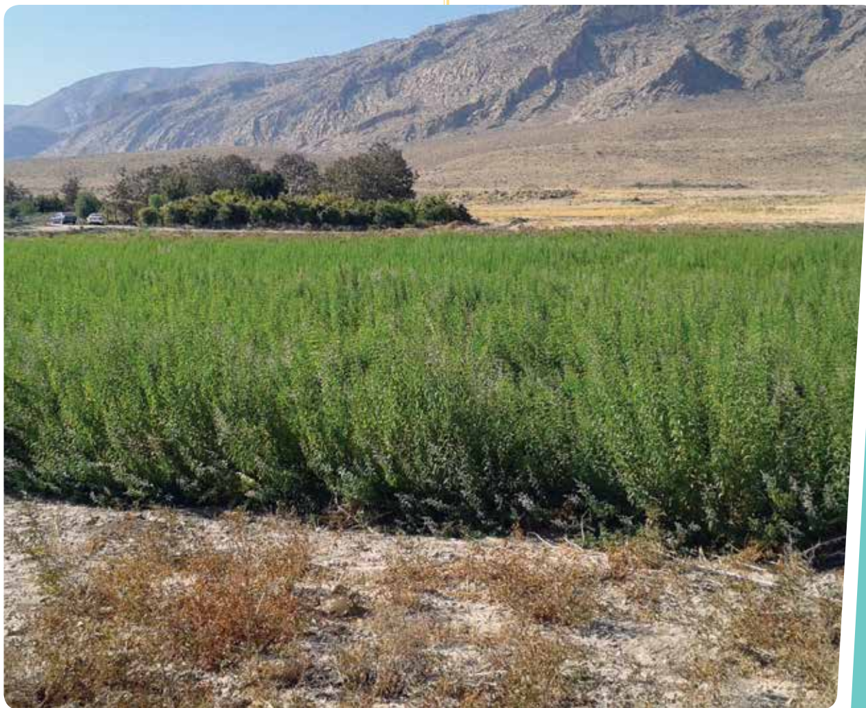
شکل ۲- مزرعه به‌لیمو ( Lippia citriodora ) در شرق شیراز

قابلیت رشد کمی و کیفی طبیعی خود را در شرایط همسان با رویشگاه مطلوب بروز می‌دهند. مصرف بیش از حد آب و کود یا جذب نشده یا اینکه موجب رشد رویشی غیرطبیعی و احتمالاً تغییر ترکیبات فیتوشیمیایی گیاهان دارویی خواهد شد. از طرفی علاوه بر خصوصیات اغلب گیاهان دارویی در ایجاد پوشش گیاهی دائمی و جلوگیری از رواناب در اراضی حساس