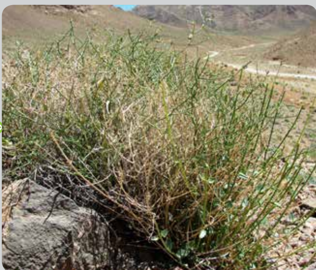
شکل ۵- گیاه کامل نخود شیرازی