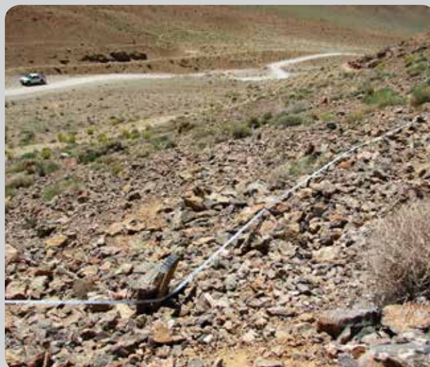
شکل ۲- منظره پلات ۲۰ در ۲۰ در رویشگاه نخود شیرازی