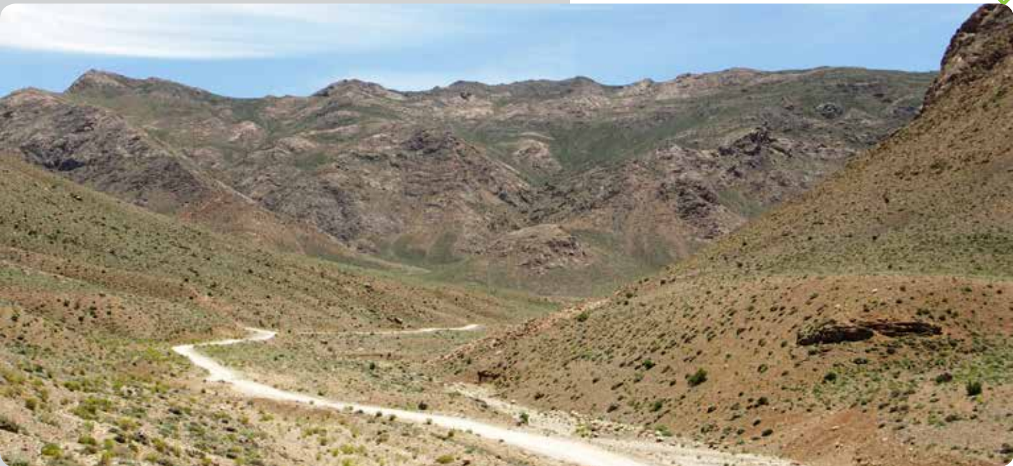
شکل ۱۰- جاده خاکی ساخته شده در رویشگاه گیاه نخود شیرازی