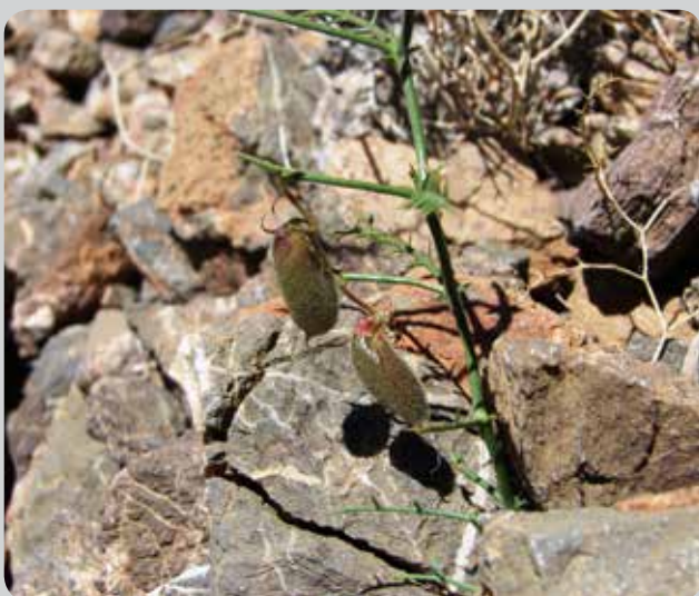
شکل ۷- میوه نیام گیاه نخود شیرازی