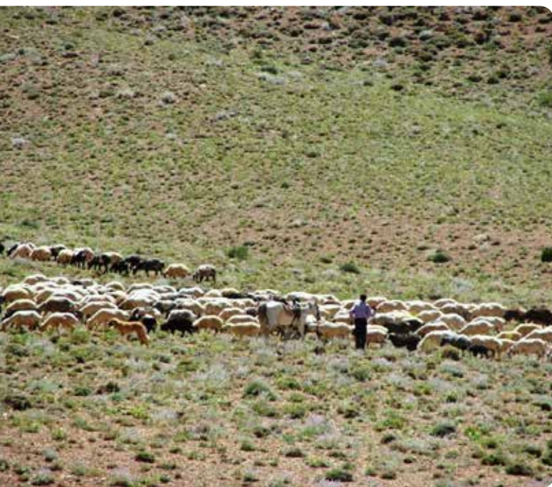
شکل ۹- چرای سنگین دام در رویشگاه گیاه نخود شیرازی

برگ منتهی به خار؛ برگچه‌های انتهایی به شکل خارهای قوی، برگچه‌های تحتانی بادبزنی و دایره‌ای کشیده. دمگل آذین یک یا دو گلی با سیخک انتهایی؛ کاسه گل در قاعده قوزدار؛ جام گل سفید یا متمایل به بنفش، رگه‌دار؛ تخمدان ۵ تا ۶ تخمکی. نیام بیضوی، دو دانه‌ای و دانه‌ها واژ تخم‌مرغی است (پاکروان، و همکاران ۱۳۷۹). مهم‌ترین صفات این گونه که باعث تمایز آن از سایر گونه‌های جنس نخود در زیر جنس Viciastrum M. Pop. و در بخش‌های Acanthocicer M. Pop. و Polycicer M. Pop. می‌شود ساقه زیگزائی و برگچه‌های بیشتر خاری آن است (شکل‌های ۵ تا ۸).