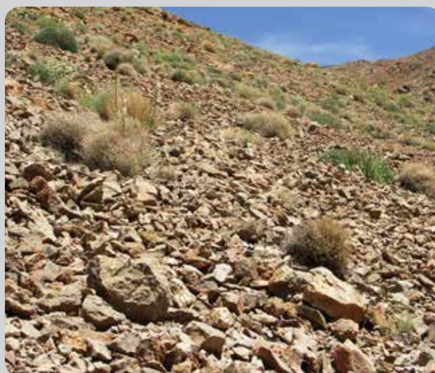
شکل ۴- نمای دیگری از واریزه‌های سنگی رویشگاه نخود شیرازی