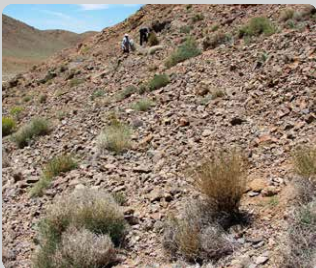
شکل ۳- واریزه‌های سنگی محل رویش گیاه نخود شیرازی