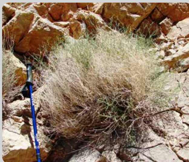
شکل ۶- نمای دیگری از گیاه نخود شیرازی