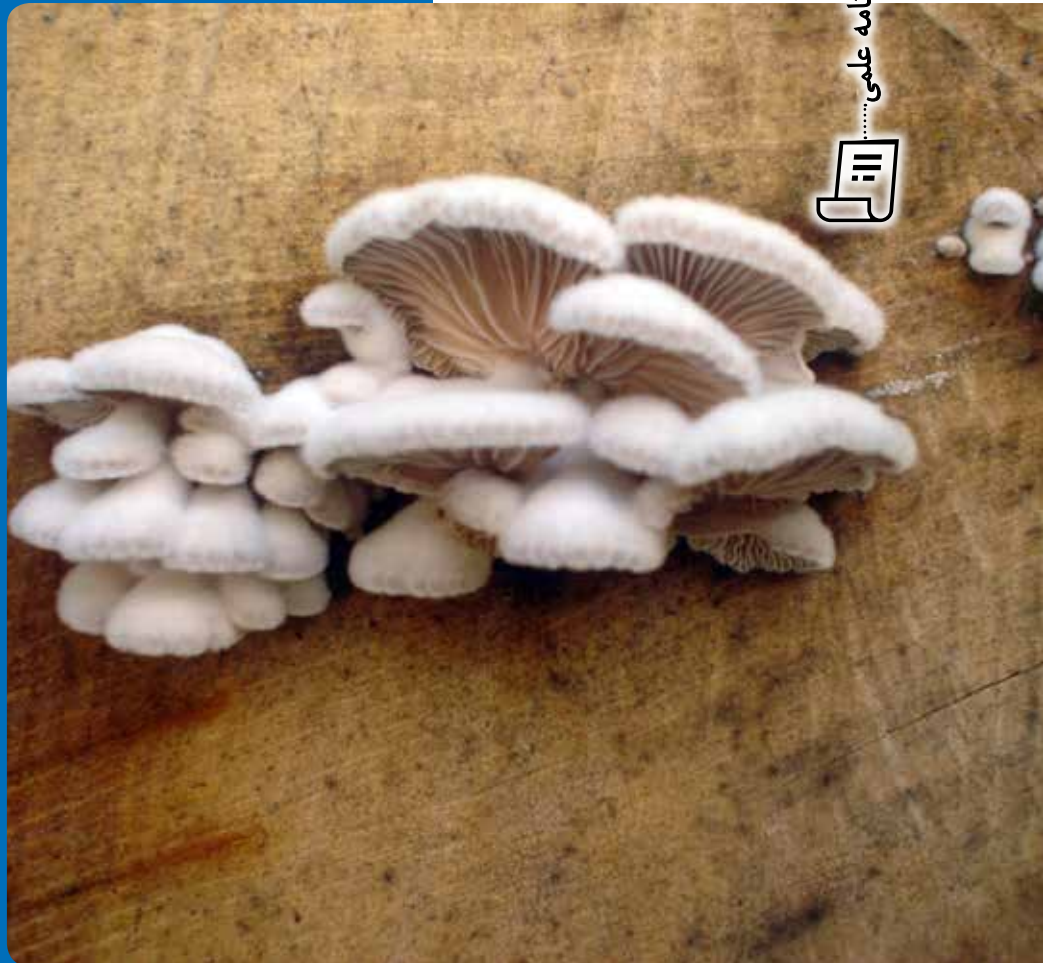
شکل ۲۲ - Schizophyllum commune

درون چوب راش، گزارش نهایی طرح پژوهشی، مؤسسه تحقیقات جنگلها و مراتع کشور، تهران، ۹۴ صفحه.