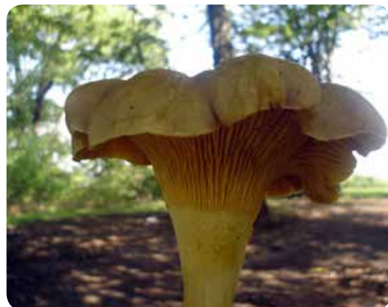
شکل ۸- قارچ اکتومایکوریز زرد کیجا Cantharellus cibarius