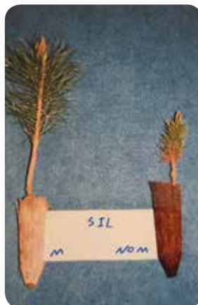
شکل ۹- مقایسه نهال مایکوریزایی با نهال شاهد

مقایسه نهال‌های مایکوریزایی و غیرمایکوریزایی نشان می‌دهد که نهال‌های مایکوریزایی از رشد ارتفاعی بیشتری برخوردار بوده و همین‌طور حجم رشدی