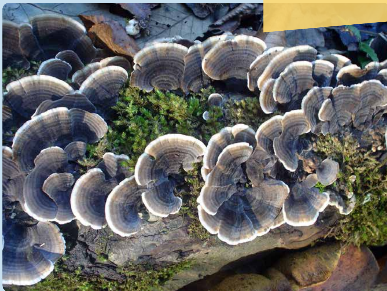
شکل ۱- قارچ رنگین‌کمان Trametes versicolor

و استفاده کاربردی از قارچ‌های جنگلی در زمینه صنعت ام.دی.اف در بازدید علمی صورت گرفته از دانشگاه گوتینگن آلمان و کارخانجات مرتبط با آن در سال ۱۳۸۶ و نیز نمونه‌های قارچی که از داخل و خارج از کشور به آزمایشگاه رسیده بر آگاهی‌ها در این مورد افزوده است. همچنین با دانشگاه Bastyr University آمریکا که روی عوامل مفید طبیعی از جمله قارچ‌ها مطالعه می‌کنند و در سال‌های اخیر ماده مؤثر قارچ دارویی رنگین‌کمان را استخراج و داروی ضدسرطان تولید کرده‌اند ارتباط برقرار شده است. حاصل بررسی‌ها منتج به این شد که باید نگرشی متفاوت و کاربردی به استفاده مفید و بهینه از این سرمایه‌های خدادادی و طبیعی داشت و تنها به مطالعه‌های پایه‌ای بسنده نکرد. در این مقاله براساس بازدیدها، مشاهده‌ها، مطالعه‌ها و منابع مربوط، یافته‌ها استخراج و ارائه شده است.