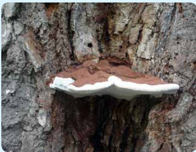
شکل ۱۳ - Ganoderma applanatum