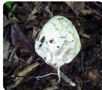
شکل ۱۹ - Phallus impudicus