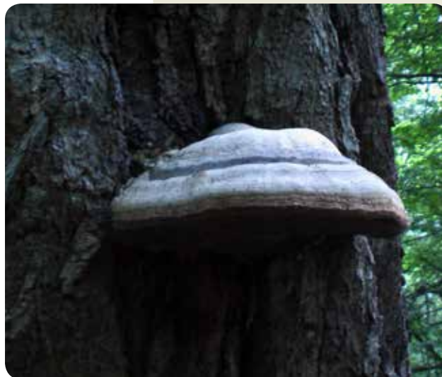
شکل ۴- Fomes fomentarius

چوب قابل تشخیص است و در بعضی موارد پوست درخت دیده می‌شود. فراوانی و فعالیت قارچ‌های ماکروسکوپی چوب‌زی به سرعت افزایش می‌یابد.