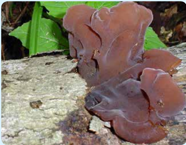
شکل ۱۱ - Auricularia auricula