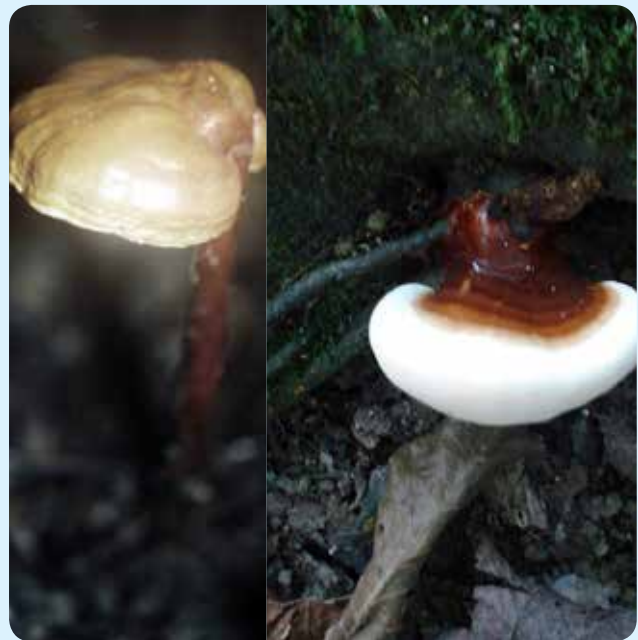
شکل ۱۴ - Ganoderma lucidum