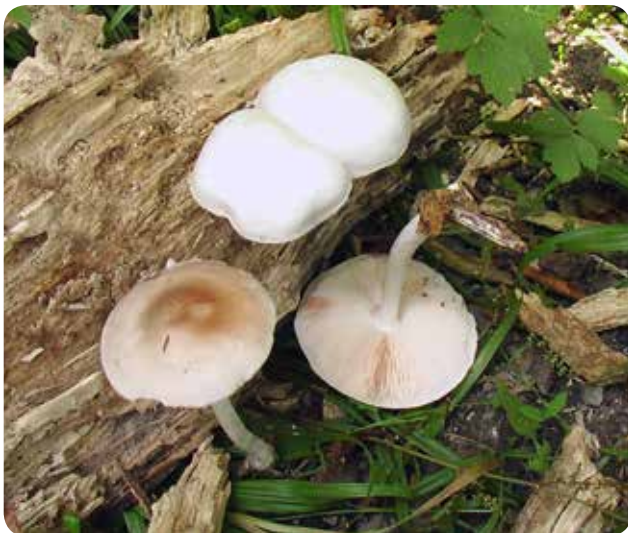
شکل ۵- Pluteus cervinus