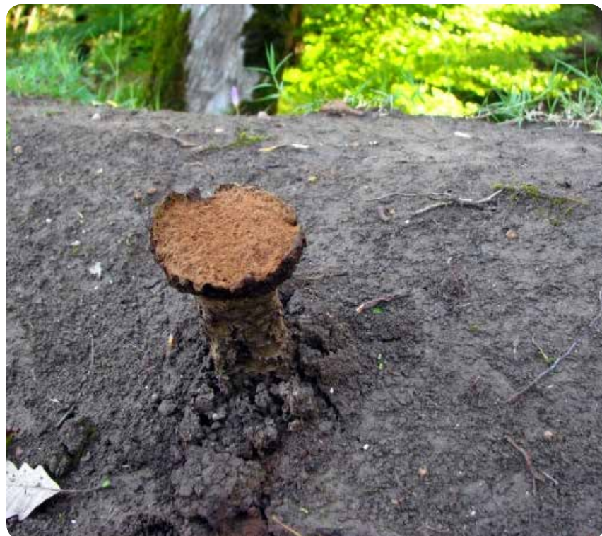
شکل ۷- قارچ اکتومایکوریز Pisolithus arhizus

استفاده‌های کاربردی از قارچ‌های جنگلی به‌ویژه قارچ‌های ماکرومیست اکتومایکوریزا، به‌منظور پایداری فضاهای سبز شهری و جنگل‌های طبیعی بسیار مؤثر است و می‌تواند یکی از فاکتورهای مهم در توسعه فضاهای سبز باشد.