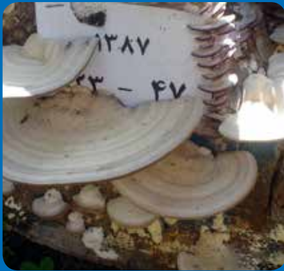
شکل ۲۳ - Trametes hirsuta