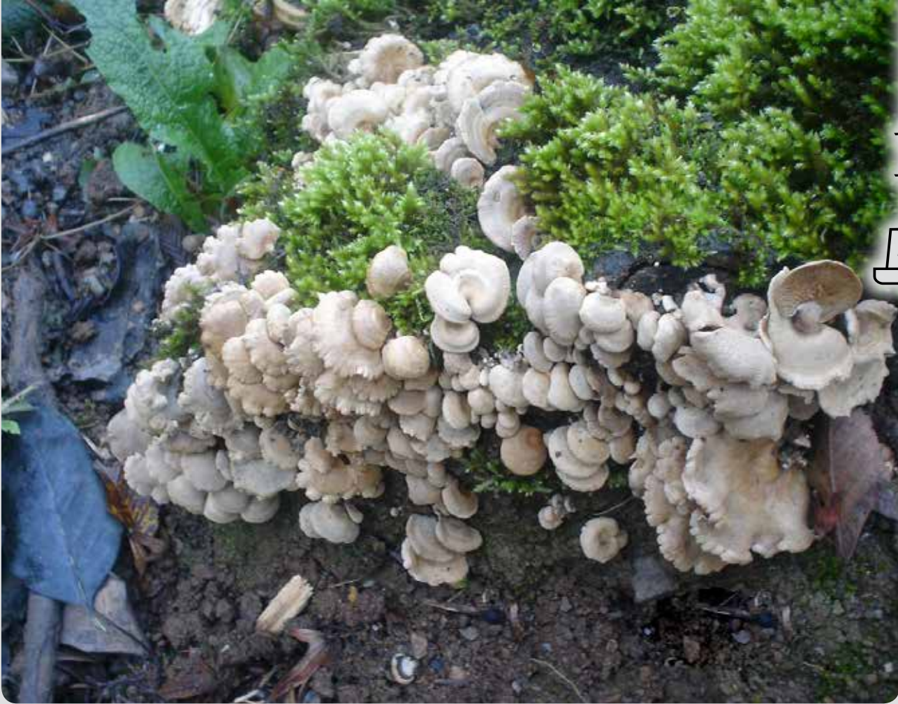
شکل ۱۶ - Panellus stypticus

Ganoderma lucidum : این قارچ دارای خاصیت آنتی‌اکسیدانت، ضدسرفه، خلط‌آور، محرک ایمنی بدن، نیروبخش و آنتی‌هیستامین است. همچنین از سنتز ماده هیستامین (C5H9N3) در بافت‌های سلولی بدن جلوگیری می‌کند (شکل ۱۴). Oudemansiella radicata : این قارچ دارای خاصیت کاهنده فشار خون است (شکل ۱۵). Panellus stypticus : این قارچ دارای خاصیت بند آورنده (styptic) خون با استعمال خارجی است (شکل ۱۶). Stereum hirsutum : این قارچ حاوی آنتی‌بیوتیک و ماده 7-ergosta و 22-din-3b-ol-1 علیه میکروبه‌های Micrococcus pyogenes , Diphtheria bacilli , Neisseria meningitides است (شکل ۱۷). Gaestrum triplex : کاربرد و خواص دارویی این قارچ عبارت است از: افزایش توان و کارکرد ریه و سیستم تنفسی، بهبود عمل حنجره و رساسازی صدا.