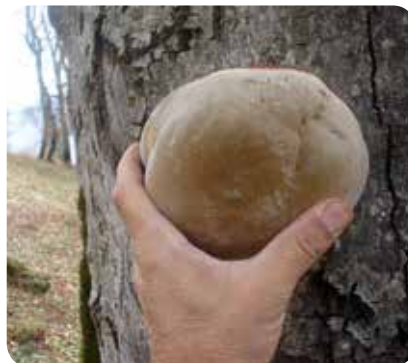
شکل ۲۰ - Phellinus igniarius