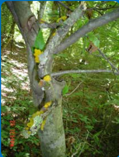
شکل ۲۴ - Tremella mesentrica