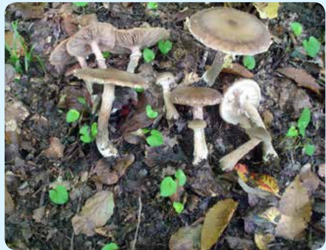
شکل ۱۰ - Armillaria mellea