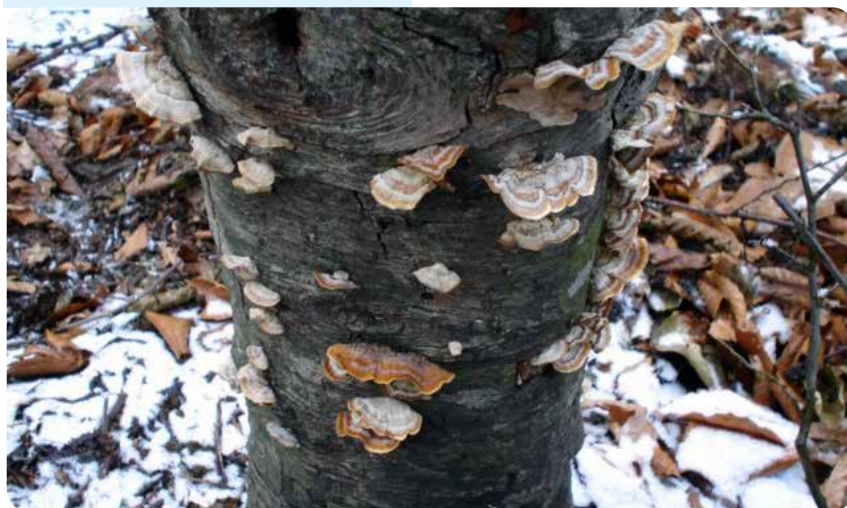
شکل ۱۷ - Stereum hirsutum