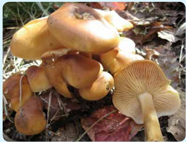
شکل ۱۲ - Flamulina velutipes