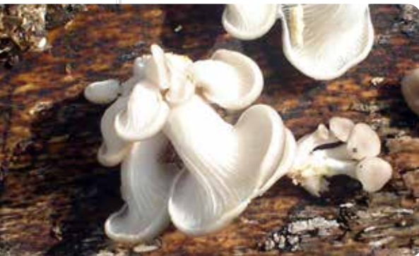
شکل ۲۱ - Pleurotus ostreatus