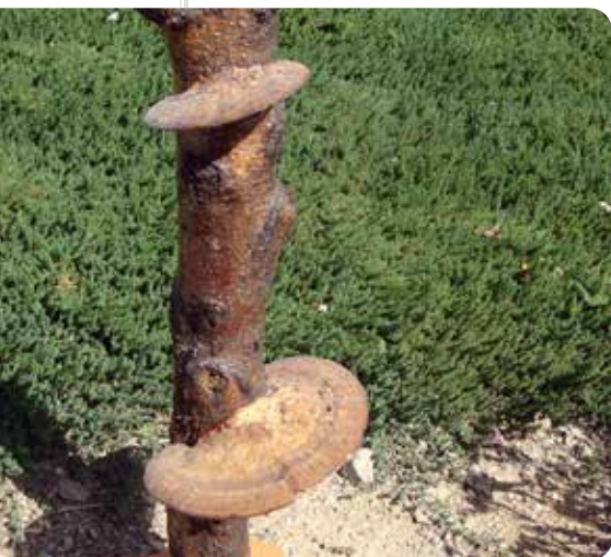
شکل ۱۸ - Lenzites betulina

Trametes hirsuta - این قارچ دارای خاصیت پیشگیری از تشکیل تومور بوده و