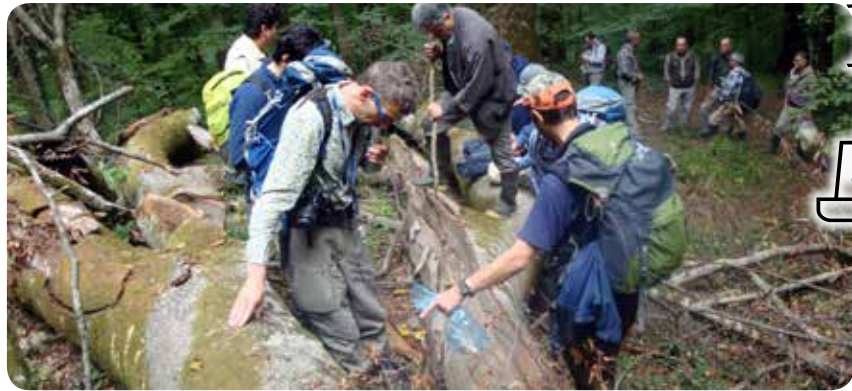
شکل ۶- بررسی توالی رویشی گروه‌های قارچی

فضاهای سبز باشد. امروزه در عرصه جهانی، تولید تجاری مایه تلقیح قارچ Pisolithus arhizus در فرماتوره‌های بزرگ انجام می‌شود و محصول به‌دست آمده به بازار عرضه شده و برای مصارف نهالستان‌های جنگلی کاربرد دارد. در ایران این موضوع هنوز در مرحله طرح‌های تحقیقاتی و پایان‌نامه‌های دانشجویی است (شکل ۷). یکی از مهم‌ترین و گسترده‌ترین قارچ‌های همزیست با درختان در راشتستان‌های شمال ایران، قارچ Cantharellus cibarius است که بومیان به آن زرد کیجا می‌گویند (شکل ۸). در گیاهان میزبان همزیست با قارچ‌های اکتومایکوریز، حجم ریشه چندین برابر افزایش یافته و در نتیجه سطح جذب برای عناصر غذایی و مولکول‌های