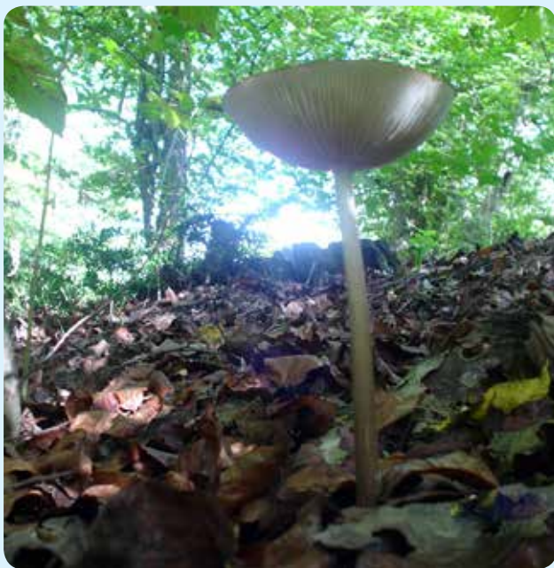
شکل ۱۵ - Oudemansiella radicata