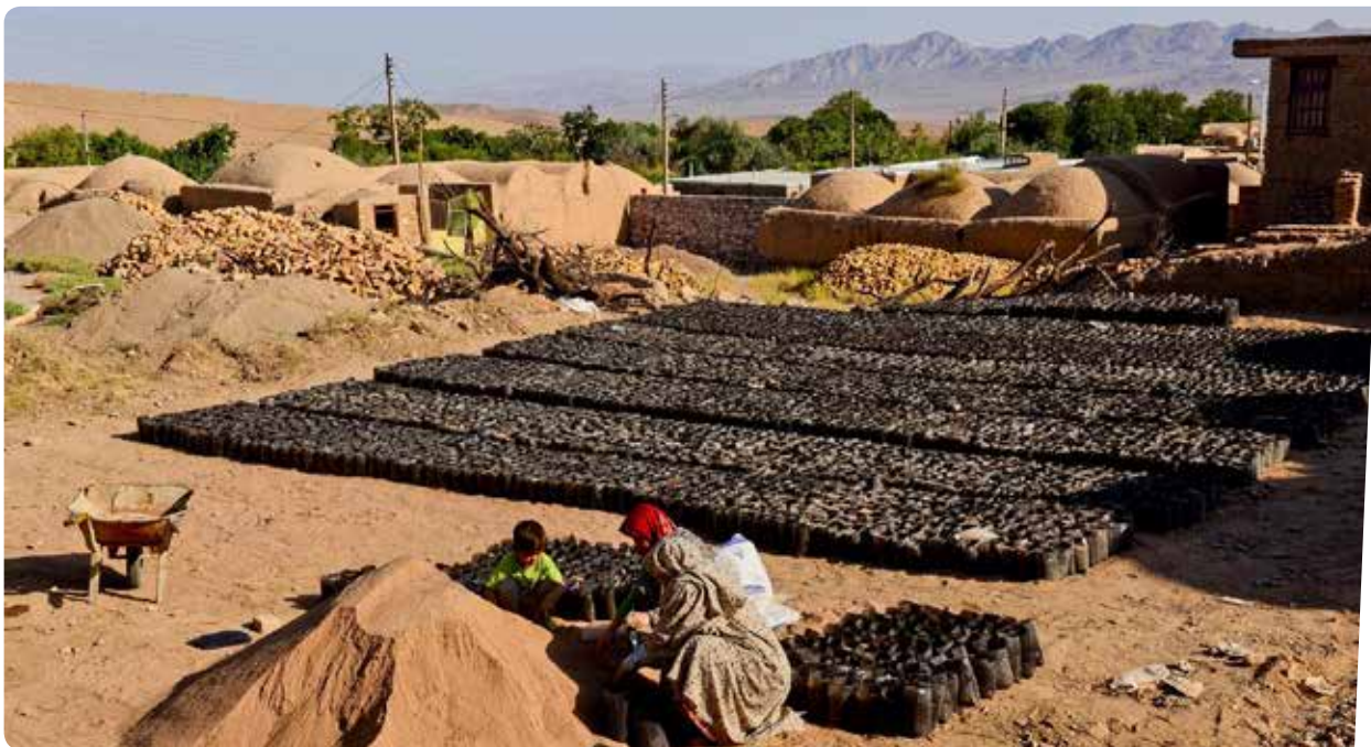
شکل ۱- مشارکت و توانمندسازی مردمی در طرح منارید (تولید نهال)

امروزه در مدیریت منابع طبیعی شاهد تأکید بر سیاست‌ها و راهبردهای مبتنی بر ارتقای معیشت بهره‌برداران از این منابع هستیم. برخی معتقدند این راهبردها ماهیت توسعه روستایی دارند و در گفت‌وگو با کارشناسان، پرسش‌هایی درباره ارتباط مدیریت منابع طبیعی و مباحث توسعه روستایی مطرح می‌شود. در واقع پرسش این است که آیا سازمان جنگل‌ها، مراتع و آبخیزداری کشور باید به توسعه روستایی بپردازد؟ و این‌که توسعه روستایی چه ارتباطی با وظایف و مسئولیت‌های آنان دارد؟ به نظر می‌رسد این پرسش از زمانی قوت گرفته که سازمان جنگل‌ها، مراتع و آبخیزداری کشور با اجرای طرح‌هایی مانند ترسیب کربن و منارید، به شکلی درگیر فعالیت‌ها و برنامه‌هایی شده که ماهیت توسعه روستایی دارند (شکل ۱). برای روشن شدن این موضوع لازم است ابعاد این قضیه مورد کنکاش قرار گیرد. در این نوشتار به برخی جنبه‌های این موضوع پرداخته شده است. امروزه این واقعیت پذیرفته شده که یکی از دلایل اصلی تخریب منابع طبیعی، فقر ساکنان و بهره‌برداران از عرصه‌های این منابع است که موجب بهره‌برداری بیش از حد و غیراصولی از آن می‌شود. در واقع، چرخه بین فقر و تخریب محیط یک چرخه تسلسلی و مرتبط به هم است. بدین معنی که یکی باعث تشدید دیگری می‌شود. فقر باعث می‌شود ساکنان عرصه‌های منابع طبیعی برای تأمین نیازمندی‌های معیشتی خود بر منابع فشار آورند و به بهره‌برداری بیش از حد از آن بپردازند. این در حالی است که بهره‌برداری بیش از حد، باعث تخریب منابعی می‌شود که این افراد برای زندگی به آن وابسته هستند. بنابراین فقر آنان بیشتر می‌شود. حال پرسش این است که آیا می‌توان مدیریت منابع طبیعی را بدون فقرزدایی دنبال کرد؟ برخی معتقدند که وظیفه و رسالت سازمان جنگل‌ها، مراتع و آبخیزداری کشور،