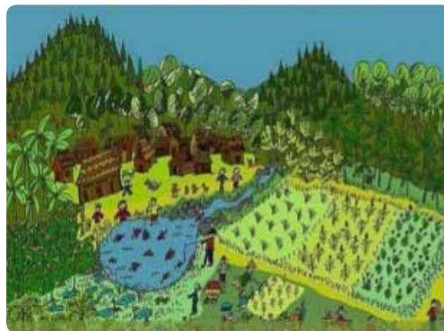
شکل ۲- ارتباط یکپارچه منابع طبیعی، کشاورزی، دامپروری و سکونتگاه‌های انسانی

واقعیت این است که با وجود احساس نیاز و تأکید بر مباحث مرتبط با مدیریت جامع و یکپارچه منابع طبیعی، پیشرفت چندانی در این رابطه تا سال‌های اخیر در کشور مشاهده نشده بود. یکی از علل آن، مدیریت و برنامه‌ریزی بخشی است که در اداره امور کشور دنبال می‌شود. در این نوع مدیریت و برنامه‌ریزی، هر بخش برای خود برنامه‌ریزی می‌کند و ارتباطی بین بخش‌های مختلف دیده نمی‌شود. بدین ترتیب، حل مسائل و مشکلات تنها از دریچه یک بخش و جدا از مسائل بخش‌های دیگر دنبال می‌شود. این نگاه که ریشه در مکتب جزئ‌نگری ۲ دارد منجر به تولید و اجرای برنامه‌هایی می‌شود که معمولاً باعث حل قطعی مشکل نمی‌شوند و تنها به صورت مسکن‌های موقتی عمل می‌کنند. به همین دلیل و با آشکار شدن کاستی‌های این نوع مدیریت و برنامه‌ریزی، به تدریج رهیافت‌ها و راهکارهایی ارائه شد که بیشتر از ویژگی کل‌گرایی ۳ برخوردارند و نگاه آنان به حل مسائل، یک نگاه نظام‌مند (سیستمی) و همه‌جانبه‌نگر است. مطرح شدن مدیریت جامع و یکپارچه منابع طبیعی یا مدیریت مشارکتی، همگی از دیدگاه اخیر نشأت گرفته‌اند که راه‌حل را در داشتن یک نگاه همه‌جانبه به مسائل دنبال می‌کنند (شکل ۲).