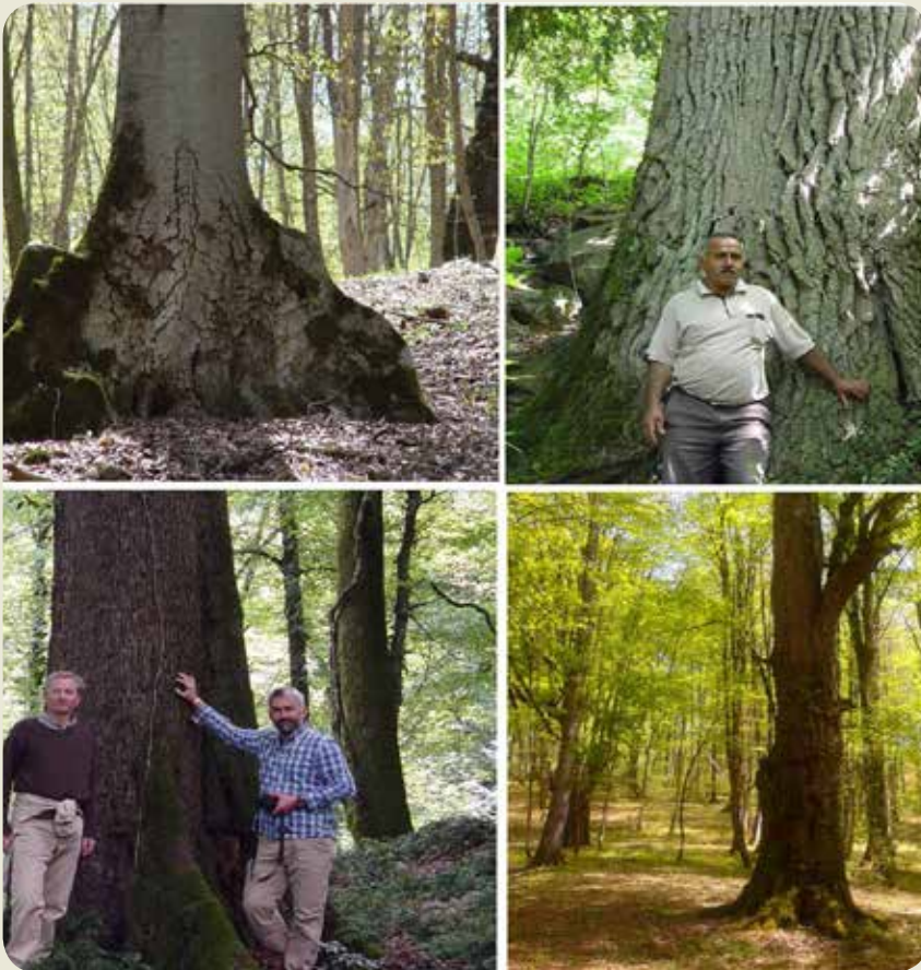
شکل ۲- چهار گونه قابل توجه در جنگل‌های هیرکانی؛ بلندمازو (بالا راست)، راش (بالا چپ)، ممرز (پایین راست) و توسکای بیلاقی (پایین چپ)

تعداد زیادی از گونه‌های سوسک از نظر حفاظت طبیعت دارای ارزش بسیار بالایی هستند. از جمله می‌توان از سوسک نادر و کمیاب Limoniscus wittmeri (شکل ۵) که مشابه و هم‌نوع اروپایی خود در حفره‌های روی تنه درخت است و سوسک Paraclytus raddei