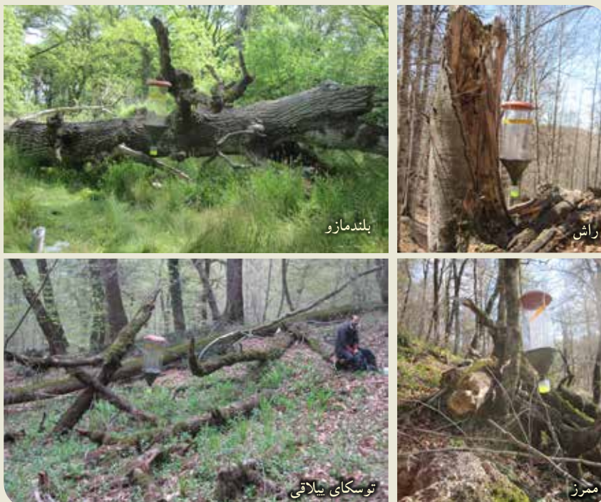
شکل ۳- تله‌های پنجره‌ای نصب شده روی درختان راش، بلندمازو، ممرز و توسکای بیلاقی