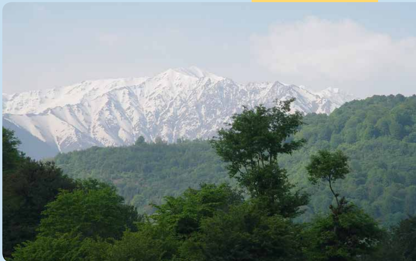
شکل ۱- جنگل‌های هیرکانی در شمال ایران

جدید زیادی توانسته‌اند در این منطقه حضور یافته و دوام پیدا کنند. مقایسه تنوع گونه‌های درختی این جنگل‌ها با درختان مشابه و تنوع موجود در اروپا اجازه می‌دهد بتوان نتیجه‌گیری مناسبی درباره نحوه تشکیل و پیچیدگی اکولوژیکی جنگل‌های هیرکانی داشت. در رابطه با خشک‌دار، چهار جنس توجه بازدیدکنندگان از جنگل را جلب می‌کند. ابتدا راش شرقی که با ابعاد بسیار بزرگ خودنمایی می‌کند و در بسیاری از نقاط به‌صورت درختان کهنسال با حفره‌ها و پوسیدگی‌های بزرگ دیده می‌شود. در کنار آن، درختان ممرز هم با تنوع زیاد قارچ‌ها و سوسک‌های روی آنها جلب توجه می‌کنند. بلندمازو و توسکای بیلاقی نیز به‌دلیل پوسیدگی ایجاد شده توسط قارچ‌های مختلف و فون و فلور وابسته به آنها، دو گونه دیگر قابل ذکر هستند (شکل ۲). منابع موجود در اروپای مرکزی